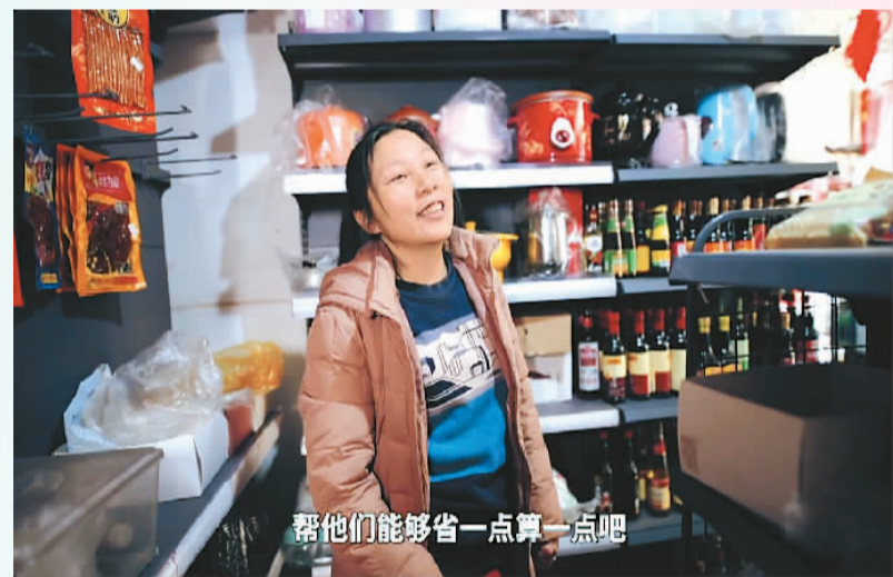
帮他们能够省一点算一点吧

这一切都让这条看起来有点陈旧的小街里，散发着平凡却可贵的烟火气。希望，正在这样的烟火气中升腾。