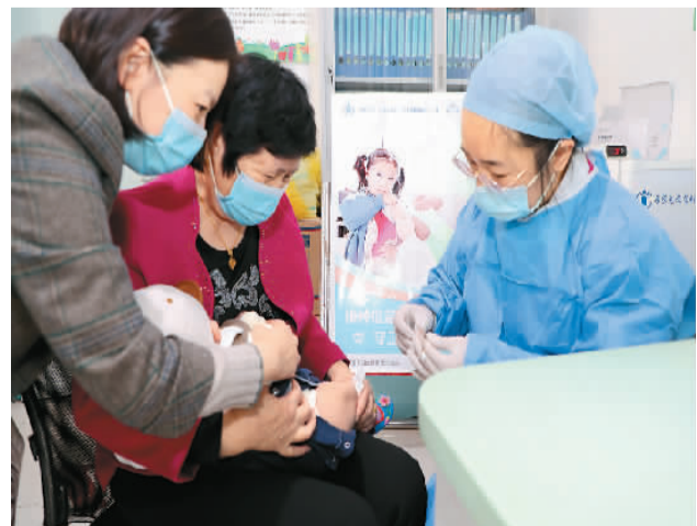
今年4月25日是第36届全国儿童预防接种宣传日，今年的宣传主题是“及时接种疫苗 保障生命健康”。

通知指出，鉴于近期新冠肺炎疫情防控形势复杂，今年宣传周活动采用线上活动为主、线上线下相结合的方式，原则上不举办大规模的线下活动，有条件的地方和企业可结合防疫要求，适当开展线下宣传活动。各地要紧密结合实际，围绕《职业病防治法》颁布实施20周年、贯彻实施《国家职业病防治规划（2021—2025年）》、推进职业健康保护行动等内容开展宣传活动。