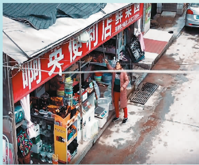
湖南省长沙市岳麓区嘉桐街上的“阿英便利店”。