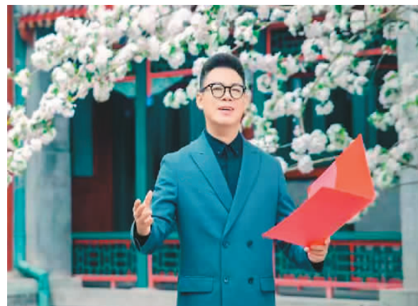
演员在海棠诗会暨宋庆龄故居海棠文化节活动现场表演诗朗诵

宋庆龄故居海棠文化节是中华人民共和国名誉主席宋庆龄同志故居文化活动品牌之一，自2010年启动后从未间断。每年4月上中旬，故居院内两株古西府海棠就会盛开，历届海棠文化节以花为媒，以文会友，吸引了海内外宾朋。