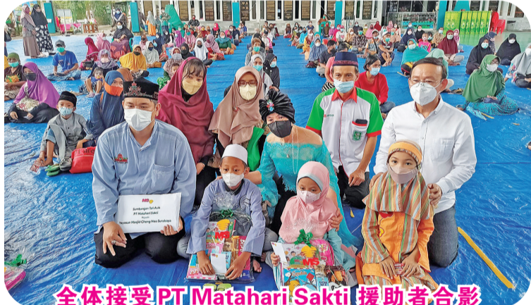
全体接受 PT Matahari Sakti 援助者合影

开展的社区服务活动确实每年都在为贫困居民和孤儿展开。她说，“我感谢郑和清真寺管理层提供的设施，并为有需要的人提供了广阔的空间。希望这将是其他人的祝福，尤其是在这疫情大流行期间。”