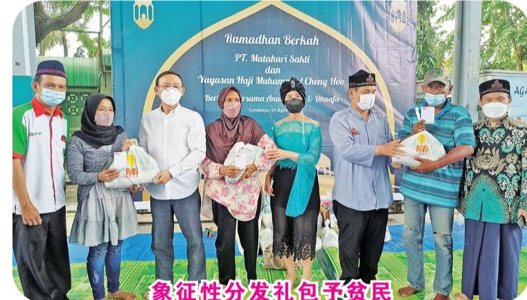
象征性分发礼包予贫民