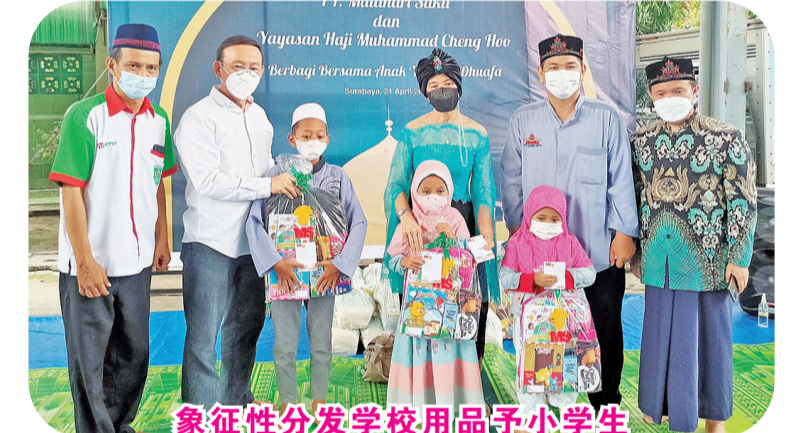
象征性分发学校用品予小学生