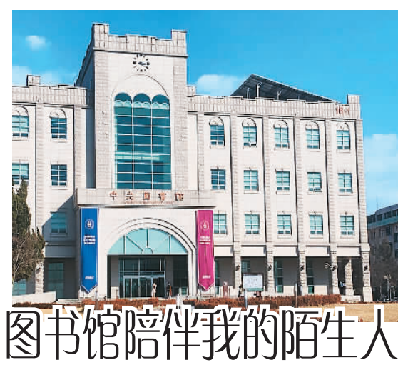
图书馆陪伴我的陌生人