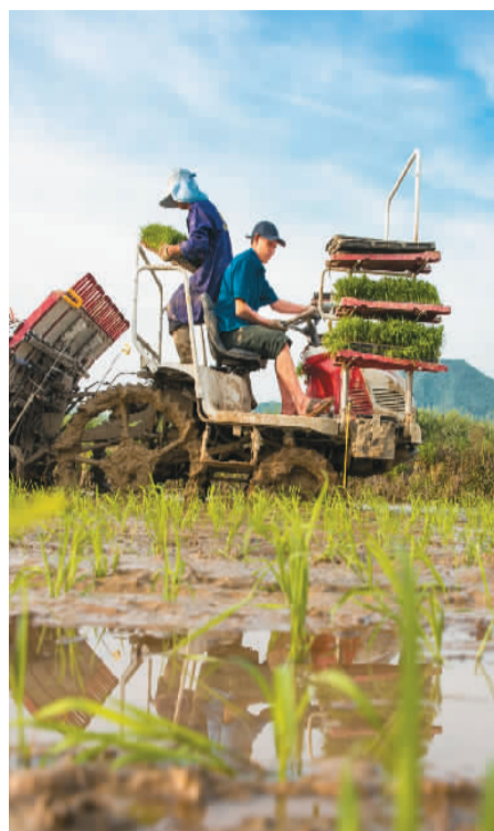
江西省九江市都昌县蔡岭镇杨湾村农民驾驶农机在田间劳作。

新华社北京4月20日电 外交部发言人华春莹20日宣布:国家主席习近平将于4月21日应邀以视频方式出席博鳌亚洲论坛2022年年会开幕式并发表主旨演讲。 以色列总统赫尔佐格、蒙古国总统呼日勒苏赫、尼泊尔总统班达里、菲律宾总统杜特尔特、哈萨克斯坦总理迈洛夫、老挝总理潘坎、国际货币基金组织总裁格奥尔基耶娃等外国领导人和国际组织负责人将应邀以视频方式出席年会。