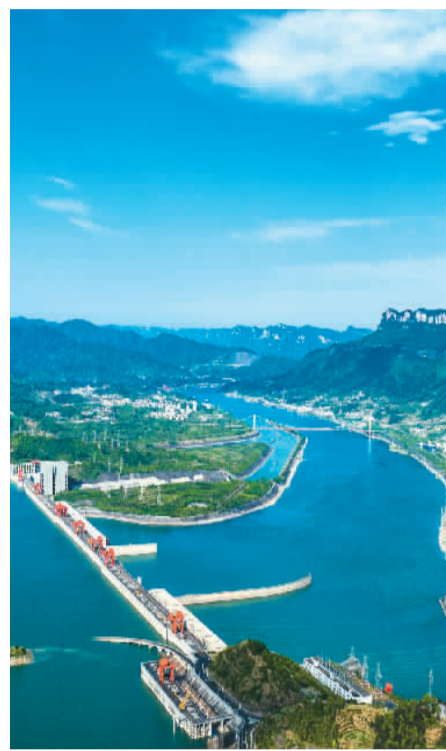
长江三峡枢纽工程稳健运行。