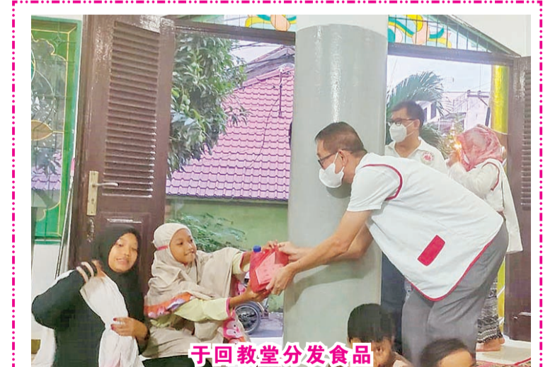
于回教堂分发食品

YIHLIP的周年庆，也是庆祝在一系列活动中，YIHLIP Lempabuditi 与 USU Fisip ERC 合作的后续行动是一项重要的持续计划。YIHLIP 将很快建立一画廊，以方便研究团队。最后闭幕会筹委向华社机构颁发感谢状结束。(国强报导)