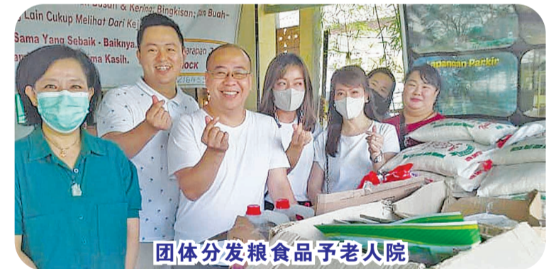
团体分发粮食品予老人院