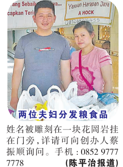
两位夫妇分发粮食品

用途。它位于Jl. Kediri desa Ramoniacek. Beringin Kab. Deli Serdang Sumut, 今已大部份竣工，估计全部经费五十多亿盾。目前仅筹集十多亿盾。 恳请社会热心人士赞助经费，无论多寡皆可，集腋成裘，众志成城，捐助者姓名将被雕刻在庭院一大块石碑上，该老人院共建有20间住房，若愿报效住房者，其