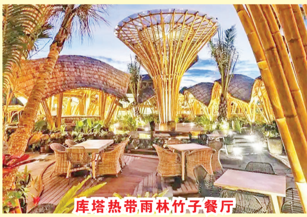
库塔热带雨林竹子餐厅