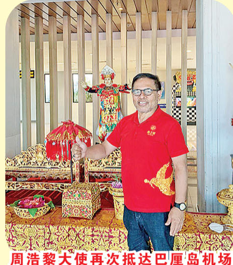
周浩黎大使再次抵达巴厘岛机场

说到印尼人出国旅游或购物,大部分首先会想到毗邻最近的新加坡。创立近80多年的亚坤咖啡吐司咖啡馆目前在印尼开了多家,尤其是切成两半的面包配上自制甜椰酱的咖啡吐司,及有着我小时候回忆的半