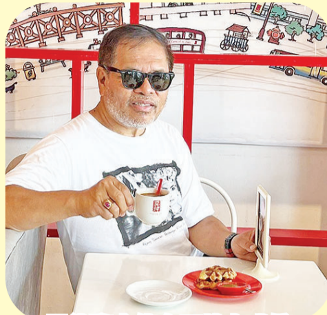
周浩黎大使在亚坤咖啡馆