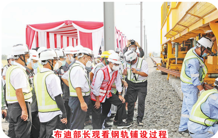
布迪部长观看钢轨铺设过程