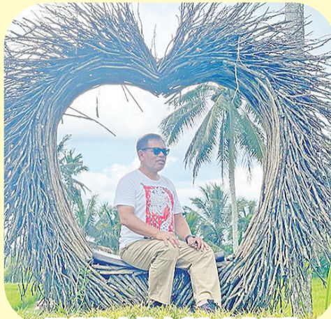
周浩黎大使在“秘密花园”