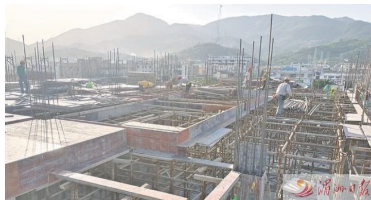
5G數字產業園施工現場。