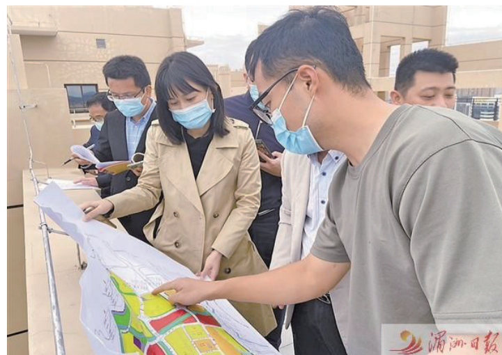
區發改局幹部下沉項目一綫解難題。