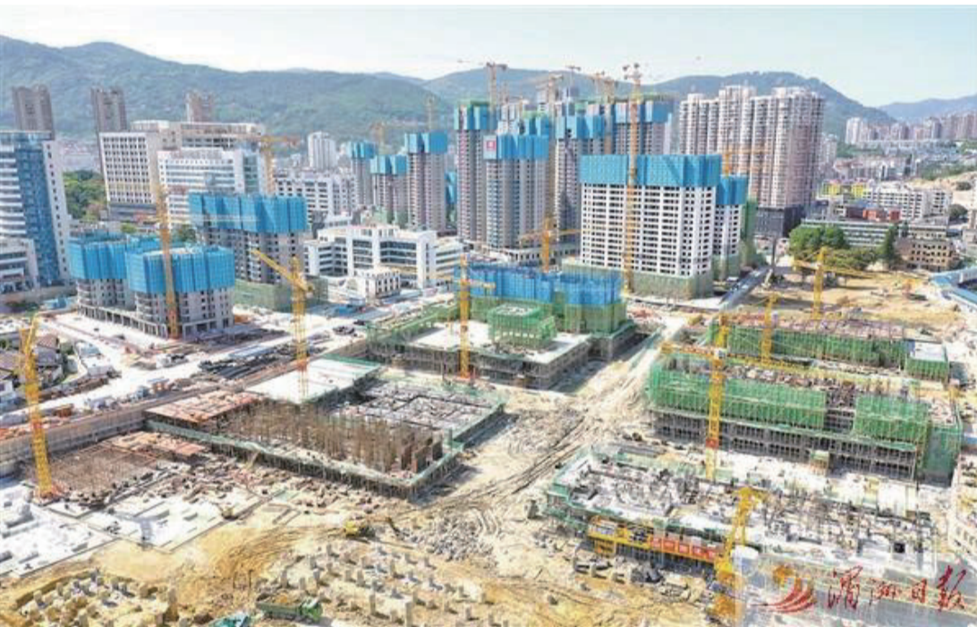
龍德井片區建設現場航拍。

衝在前列，跑出精彩。城廂區立足新常態，適應新政策，強化項目招商、保障、服務等，通過“三員機制”確保項目建設“不斷線”，招商引業“不斷鏈”，推動發展“撐杆跳”。