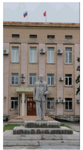
烏克蘭格尼奇斯克市議會大樓前豎起列寧的雕像