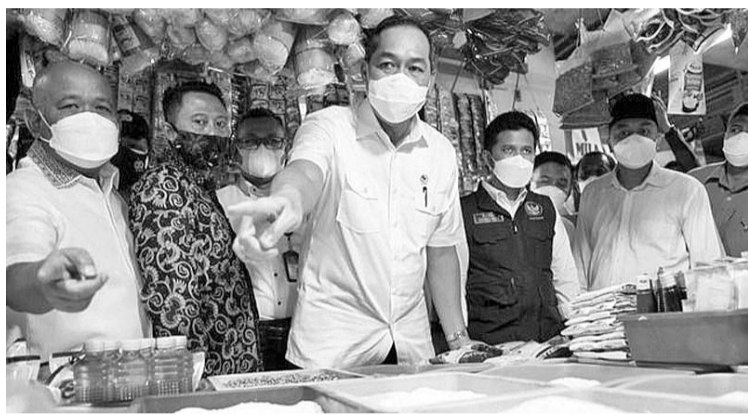
贸易部长鲁特菲(中)视察市场

【本报讯】贸易部长鲁特菲(Muhammad Lutfi)表示，截至4月18日(星期一)，全国基本商品平均价格保持稳定。不仅如此，基本粮食的库存是安全的。鲁特菲指出，例如对于价格，上涨仅出现在白糖和牛肉。根据贸易部掌握的数据，白糖价格为每公斤1万4700盾，比上个月上涨2.8%，而国家库存仍然足够未来两个月。牛肉价格为每公斤13万3100盾，比上周上涨0.6%。然而，总体而言，仍比去年斋戒期间的价格低0.82%。除这两种商品外，其他食品价格趋于下跌。以大米为例，4月18日的平均价格为每公斤1万400盾，比去年的开斋节期间