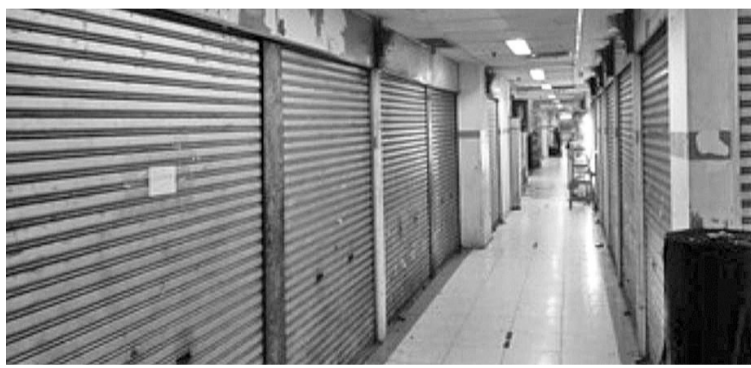
雅加达草埔商场许多店铺关门大吉

班札伊丹最后说，目前，有很多提议将总统提名门槛设为0%。我认为，此提案来自民众的呼声；这是民主的声音，来自民众本身的大多数人的声音。这必须去聆听。(亮剑)