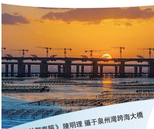
《并駕齊驅》陳明理 攝于泉州灣跨海大橋