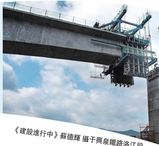
《建設進行中》蘇德輝 攝于興泉鐵路洛江段