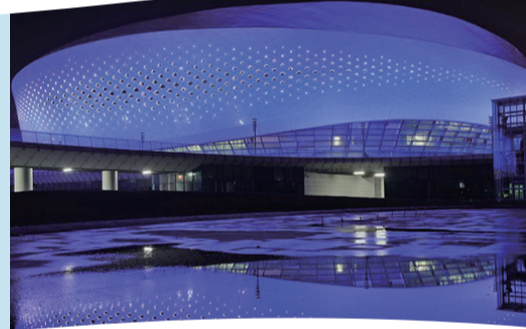
《五彩世界》于晉江市第二體育中心