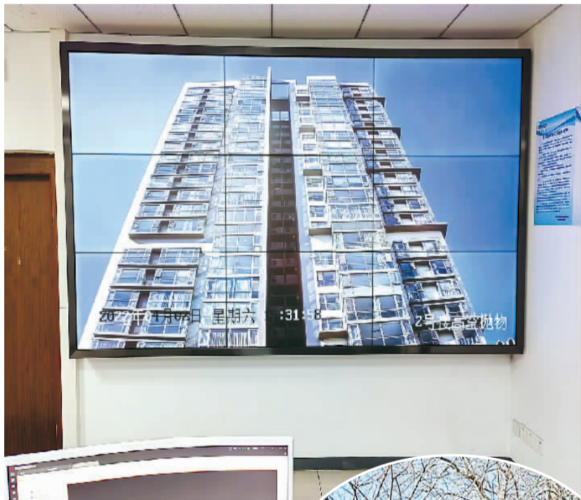
▲北京市朝阳区博雅园小区中控室的大屏幕上，清晰显示2号楼高楼层外立面。 ▶博雅园小区内安装的高空抛物监控设备。