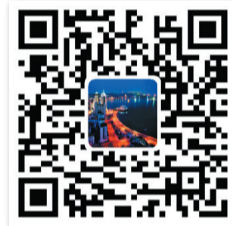
青島發佈官方微博二維碼

在全球疫情更趨復雜的情況下,保障國際通道暢通是作為對外開放“橋頭堡”的青島港必須承擔的責任。“越是面對挑戰,越是要看到機遇。港口的服務水平不但不能下降,生產績效還要進一步提升,吸引各大船公司將青島港作為全球航綫布局的樞紐。”張軍介紹,“按照國家相關政策,我們正在探索對國際航行船舶實行無接觸作業,最大程度降低對生產的影響。”(周曉峰)