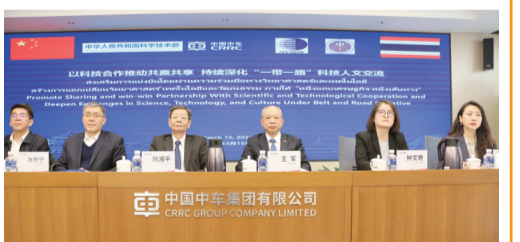
【“雲簽約”現場。】