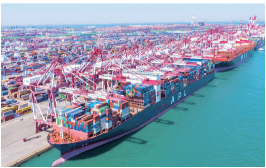
【山東港口青島港前灣集裝箱碼頭。】

中國北方第一大外貿口岸——山東港口青島港集裝箱吞吐量再創歷史同期新高。中國交通運輸部發布的最新數據顯示,今年前兩個月青島港完成集裝箱吞吐量372萬標箱,同比增長6.1%。