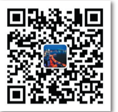
青島發佈官方微信二維碼