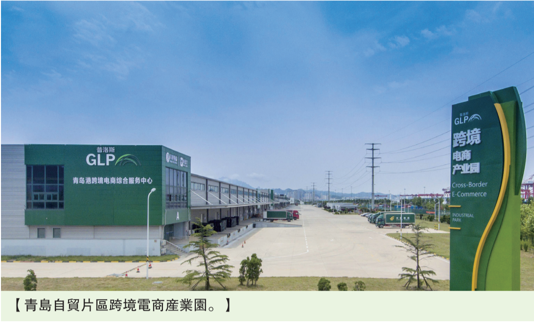
【青島自貿片區跨境電商產業園。】

近日印發的《中國(山東)自由貿易試驗區聯動創新區建設實施方案》提出,以青島自貿片區為核心,組團聯動本省周邊地區打造國際貿易聯動創新區。根據上述方案,青島自貿片區將聯動濰坊濱海經濟技術開發區開展油品貿易合作,聯動陽谷經濟開發區開展銅礦貿易合