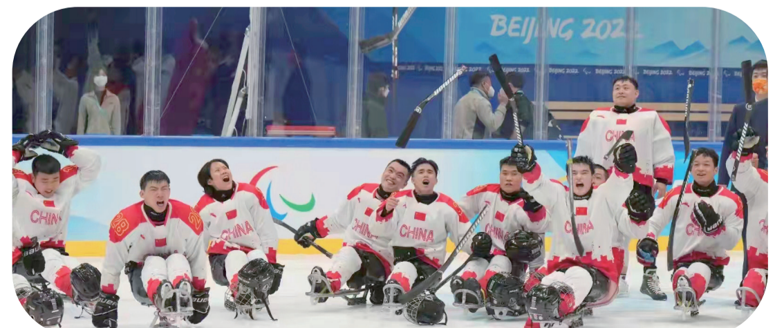
【北京冬殘奧會期間,中國殘奧冰球隊隊員們在比賽結束後高興地慶祝。】

近日,中國-泰國軌道交通聯合實驗室共建實施暨中泰高鐵路教學計劃諒解備忘錄(MOU)通過“雲簽約”的形式簽署。中車四方股份公司、北京交大、西南交大、中南大學與泰國科學技術研究院(TISTR)及泰國5所高校,將在中泰兩國高鐵路科技合作中邁上新臺階。