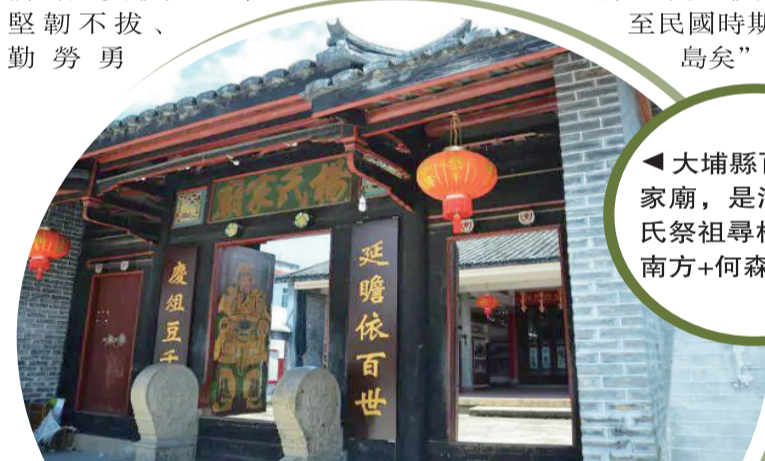
▲大埔縣百侯楊氏家廟，是海內外楊氏祭祖尋根之處。