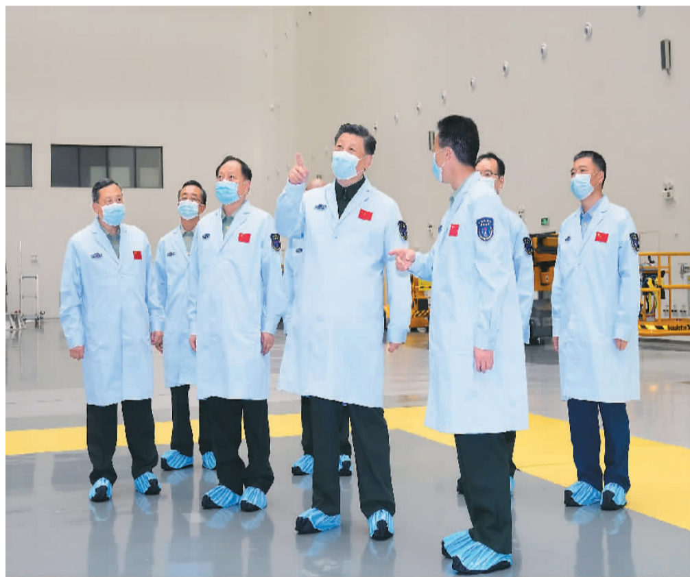
四月十二日下午, 中共中央总书记、国家主席、中央军委主席习近平到文昌航天发射场视察, 代表党中央和中央军委, 向发射场全体同志致以诚挚问候。图为习近平来到技术测试厂房, 详细了解有关任务准备情况。

■ 文昌航天发射场是我国新一代大推力运载火箭发射场, 是我国深空探测的重要桥头堡, 在我国航天体系中具有特殊重要地位和作用。要大力弘扬“两弹一星”精神、载人航天精神, 坚持面向世界航天发展前沿、面向国家航天重大战略需求, 强化使命担当, 勇于创新突破, 全面提升现代化航天发射能力, 努力建设世界一流航天发射场 ■ 按照既定部署, 今年我国将完成空间站建造任务, 天舟四号、五号货运飞船和问天、梦天实验舱将从文昌航天发射场发射升空。要精心准备、精心组织、精心实施, 确保发射任务圆满成功, 以实际行动迎接党的二十大胜利召开