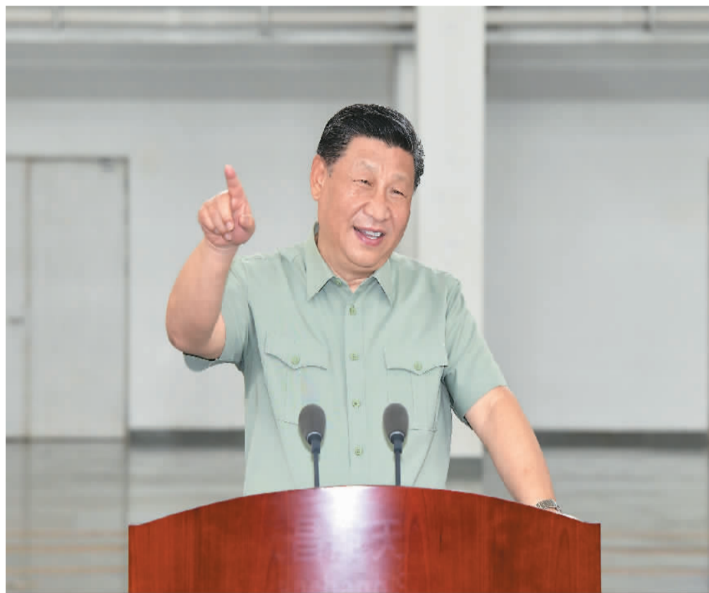
四月十二日下午, 中共中央总书记、国家主席、中央军委主席习近平到文昌航天发射场视察, 代表党中央和中央军委, 向发射场全体同志致以诚挚问候。图为习近平发表重要讲话。