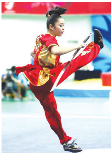
2014年亚运会的金牌得主 莱薇塔·妮莎