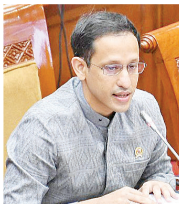
文教科研部长纳迪恩

【本报讯】文教科研部长纳迪恩(Nadiem Makarim)于4月12日(星期二)在