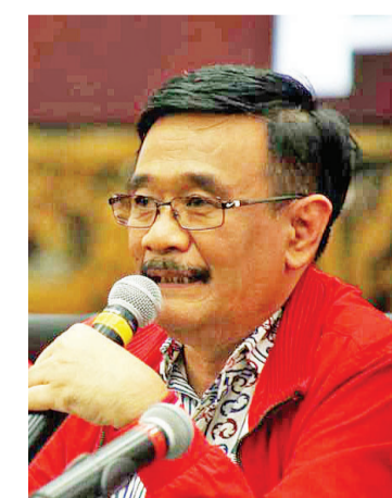
斗争民主党中央理事会主席查罗