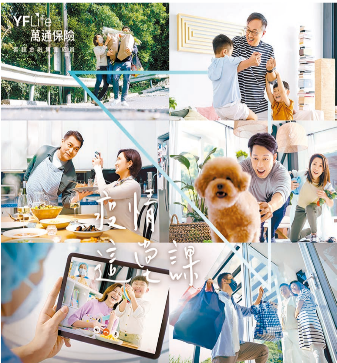
「疫情這堂課」刻畫萬通保險顧問活出「疫下同行，溫暖相守」的六則小故事，透過當中的人、事、物，啓迪疫情下的生活省思。

的關鍵。在疫情的陰霾籠罩下，我們推出「疫情這堂課」這個品牌企劃，並由多位萬通保險顧問真情演繹具有溫度的小故事，從而鼓勵大家，在嚴峻的疫情下，只要以心待人，才有真誠；以善愛人，才有可能。只要時刻保持正面樂觀的心態，為身邊的人多行一步，散發正能量，就能拉近人與人之間的距離。」