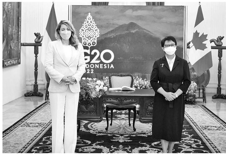
蕾特诺外长会见加拿大外交部长梅兰妮·乔利(左)

部长梅兰妮·乔利的访问时发表这一声明。 蕾特诺外长称道，明智的决定是必要的，尤其是在俄罗斯入侵乌克兰仍在发生的充满挑战的时期。在这个充满挑战的时期，我国将继续与所有G20成员国进行沟通和磋商。我们非常感谢加拿大对我国担任G20轮值主席国的支持。 与此同时，加拿大外长乔利承认支持我国担任G20轮值主席国。乔