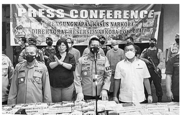
巴厘警方破获价值560亿盾毒品

【本报讯】巴厘省警区在破获了数十公斤各类毒品案件，价格约达560亿盾。 巴厘警区长普图少将(Putu Jayan Danu Putera)表示，据巴厘警方缉毒组透露，缉获的各类毒品是过去两年中最大的一次。 巴厘警区长普图4月12日(星期二)在登巴刹市的巴厘警区举行的新闻发布会上指出，这起案件是巴厘岛警方在过去两年中破获的最大的毒品。如果估计其价值大约是560亿盾。若被不负责任的人吸食，可达35万人。至少，我们可以拯救大约35万国家儿女。 在此次的逮捕行动中，共有三名嫌疑人被捕，他们分别是巴厘邦利县(Bangli)金塔马尼镇区(Kintamani)巴图康乡(Batu-kaang)的KS(35岁)、登巴刹的KW(48岁)和巴通(Badung)县区的AA(48岁)。 普图声称，嫌疑人的作案手法是将毒品存放在别墅内，然后将毒品分发给经常光顾塞米娘(Seminyak)、长谷(Cangu)和佩蒂腾月(Petitengget)地区娱乐场所的外国人。嫌疑人将非法货物存放在巴通县区北库塔镇区(Kuta Utara)克罗博坎·格鲁(Kerobokan Kelod)乡的一栋别墅中。 此前，警方从Kerobokan Kelod乡附近的民众获得信息，说是在那里滥用毒品事件时有发生。为此，警方进行了调查，4月8日(星期五)晚上19:00 左右，巴厘警区缉毒组在别墅前逮捕了两名嫌疑人KS和KW，并立即对嫌疑人AA展开调查。在搜查过程中，警方发现了一个装有违禁物品的塑料袋，在对别墅进行搜查过程中，发现了数十公斤各类毒品，共计35.1公斤。 计有甲基苯丙胺35克、可卡因32克、大麻2.6克、合成毒品7.38克、796粒胶囊中的粉末151克、粉红色合成毒品49克、橙色毒品1.2克(摇头丸)。此外还有，精神药物形式为0.5克维他命、500片丙干盐酸相当于80克净重、500片伐地美片相当于70克净重、500片阿普唑仑相当于55克净重。 普图警长表示，这不是一个家庭作坊，他们只是把它混合起来，装回胶囊里，这样更容易卖。我们看到这里含有麻醉剂的胶囊，销售目标为夜总会。货物可能来自中国，但仍在调查中。原因在于，被没收的34包冰毒发给经常光顾塞米娘(Seminyak)、长谷(Cangu)和佩蒂腾月(Petitengget)地区娱乐场所的外国人。嫌疑人将非法货物存放在巴通县区北库塔镇区(Kuta Utara)克罗博坎·格鲁(Kerobokan Kelod)乡的一栋别墅中。 普图指出，如果货物是从中国包装的，那么这里就是中继站。但我们正在展开调查的是，上游在哪里，最后在哪里。警方猜测，货物可能通过陆路或海路进入巴厘岛。警方仍在着手调查此案，以查明其他嫌疑人。 (亮剑)