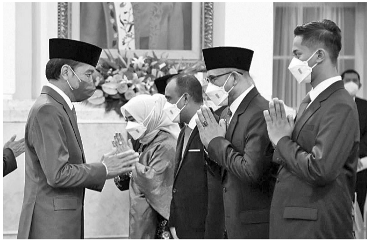
佐科维总统在雅加达独立宫为七名普选委员会成员和五名普选监督委员会成员主持就职仪式

【本报讯】佐科维总统要求普选委员会(KPU)除了为2024年大选与地方领导人选举做好准备外，还要关注民众的政治教育。 佐科维总统4月12日(星期二)表示，不要再让民众被身份认同政治问题所挑衅。 值此之际，佐科维表示，希望刚刚就职的2022-2027年普选委员会与普选监督委员会的成员，能够立即与各党派合作，为民主盛会做好准备。 佐科维指出，大可以立即踩油门，与国会和政府协调履行职责和权力，按照2024年确定的阶段为大选和地方领导人选举