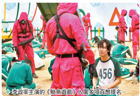
李政宰主演的《魷魚遊戲》入圍多項百想提名。

(黃東赫) 最佳男配角 (許成泰)，最佳女配角 (金姝伶)，最佳女新人 (鄭浩妍) 以及最佳男主角 (李政宰) 等。今屆李政宰的對手包括《讀取惡心的人們》金南佶、《衣袖紅鑲邊》李俊昊、《Tracer》任時完及《D.P：逃兵追緝令》丁海寅。