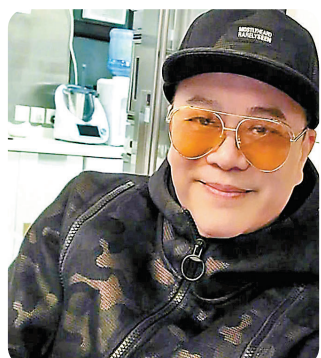
歐陽震華響應呼籲做檢測。