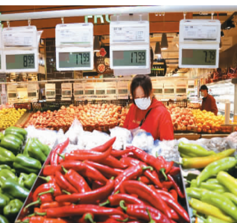
图为4月11日，顾客在江苏省连云港市连云区一家超市选购商品。

点；鲜菜价格由上月下降0.1%转为上涨17.2%；食用植物油、鲜果和水产品价格分别上涨6.1%、4.3%和4.2%，涨幅均有回落；面粉价格上涨4.6%，涨幅扩大1.9个百分点。中国民生银行首席研究员温彬对记者分析，从环比看，食品价格由上月上涨1.4%转为下降1.2%，影响CPI下降约0.22个百分点。其中，受节后消费需求回落及供给充足等因素影响，猪肉价格下降；受国际小麦、玉米和大豆等价格上涨及国内疫情影响，面粉、食用植物油、鲜菜价格上涨。据国家统计局数据，3月份，非