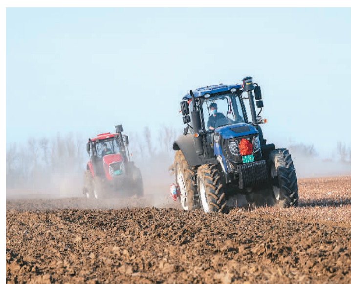
随着天气渐暖、气温攀升，新疆由南至北的广大棉田陆续启动春耕，各族农民群众抢抓农时，在田间地头开展生产。智慧农机也在棉田里大显身手，尽显“科技范儿”。图为在新疆乌鲁木齐市石桥乡的一处棉田里，国产大马力拖拉机在犁地。

本报北京4月11日电（记者徐佩玉）11日，记者从中国汽车工业协会获悉，3月份，汽车产销分别达到224.1万辆和223.4万辆，环比增长23.4%和28.4%，同比下降9.1%和11.7%。其中，新能源汽车产销继续保持增长的好势头。1—3月，汽车产销648.4万辆和650.9万辆，同比增长2%和0.2%，增速有所回落。3月份，新能源汽车产销分别