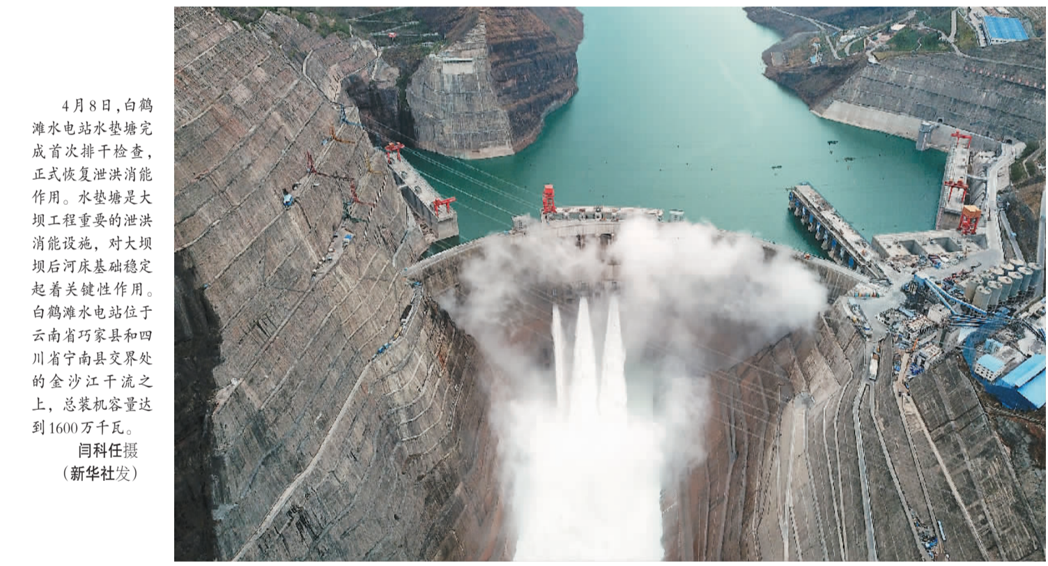
4月8日，白鹤滩水电站水垫塘完成首次排干检查，正式恢复泄洪消能作用。水垫塘是大坝工程重要的泄洪消能设施，对大坝坝后河床基础稳定起着关键性作用。白鹤滩水电站位于云南省巧家县和四川省宁南县交界处的金沙江干流之上，总装机容量达到1600万千瓦。