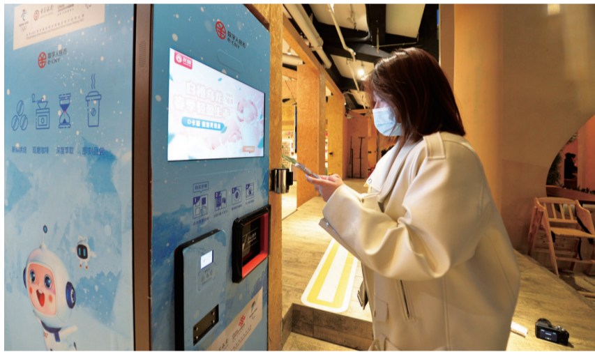
福州市民在唯美客文创聚落体验数字人民币支付。

【福州晚报讯】4月2日,中国人民银行发布消息,包括福州、厦门在内的11个城市,成为数字人民币第三批试点地区。这几天,一些福州市民开始尝鲜使用数字人民币。作为试点地区,数字人民币又能给福州带来哪些便捷和红利?记者带您深入了解数字人民币。