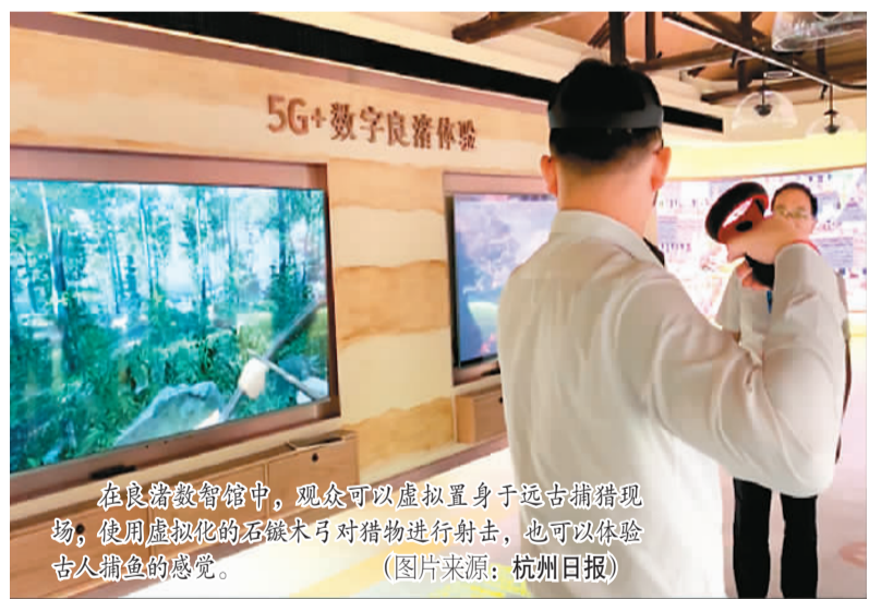
在良渚博物馆中，观众可以虚拟置身于远古狩猎现场，使用虚拟化的石箭头对猎物进行射击，也可以体验古人捕鱼的感觉。