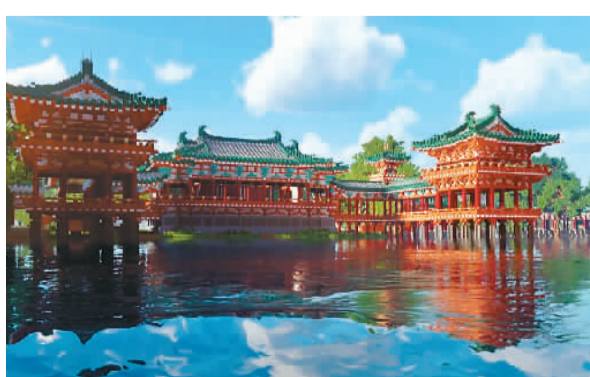
在《大唐·开元》元宇宙项目中，体验者可以参观唐长安城的主体建筑建设进程，还可以共同参与其规划和建设。

截至目前，文博圈中的元宇宙产品、历史文化遗产同元宇宙的融合局面都尚处于探索发展的萌芽期，有赖于数