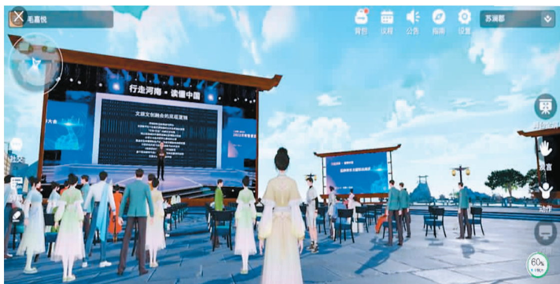
2022年3月，在河南举办的智慧旅游大会上，元宇宙会场首次亮相。参会人员可以通过在线上元宇宙会议空间沉浸式参会，了解“行走河南·读懂中国”品牌体系主题项目展示，以亲临现场的视角体验更新颖的互动。