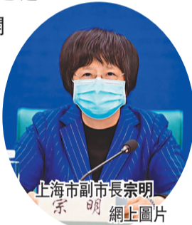
上海市副市長宗明

15萬例。結合此前多輪篩查的情況，上海已於9日起再次開展一次全員核酸檢測，並將根據檢測結果分析研判，實施分區分級差異化防控，依據風險程度的大小，按照「三區劃分」原則，進行階梯式管理。上海市副市長、市疫情防控工作小組副組長宗明9日在上海市政府新聞發布會上表示，「很多工作我們做得還很不夠，離大家的期望還有很大的差距，我們一定盡全力改進。」