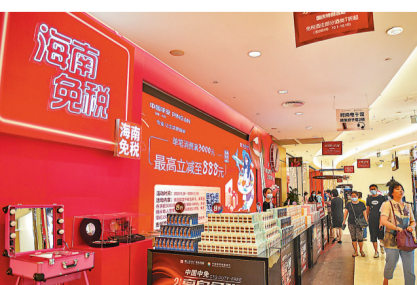
◆海南自貿港2025年前適時啟動全島封關運作。早前消費者在海口免稅店選購商品。

瞄準2023年底具備封關硬件條件、2024年底完成封關各項準備的總體目標，海南正積極推進有關工作。硬件建設方面，目前已梳理50多個封關項目，計劃總投資180多億元人民幣；軟件建設方面，將加快推進稅制安排、金融配套、法律法規、體制保障等政策和制度層層設計。