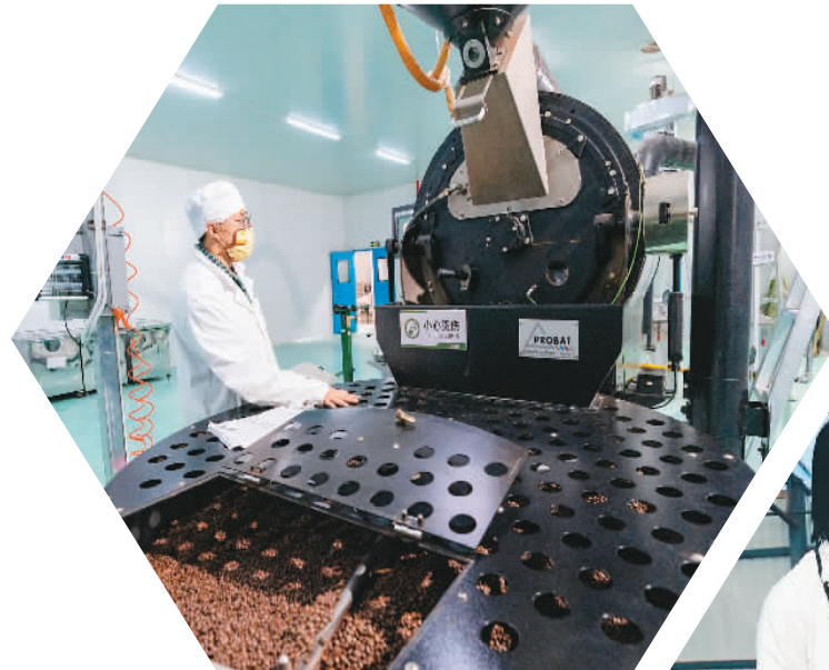
▲ 2月22日,云南普洱爱妮庄园咖啡有限公司工作人员在烘焙豆生产线上忙碌。