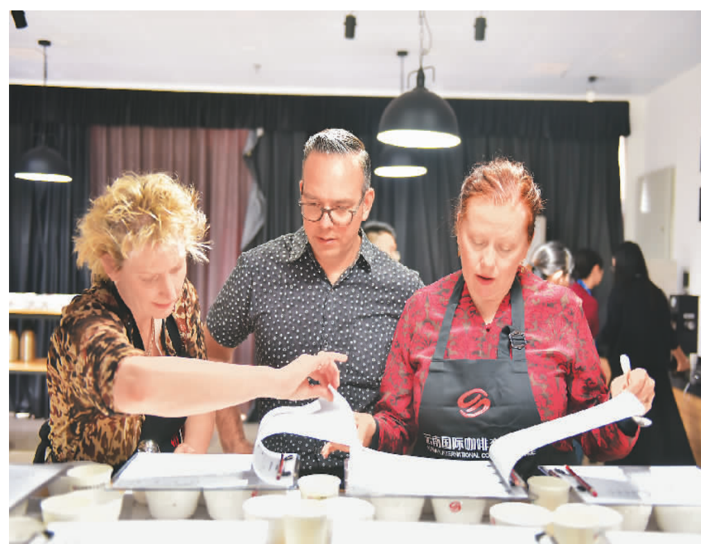
▲ 二〇一八首届普洱国际精品咖啡博览会期间,国外专家在云南国际咖啡交易中心杯测室,对云南咖啡进行杯测。

在普洱市孟连傣族拉祜族佤族自治县,去年冬天至今,咖啡产业为包括拉祜族、佤族等直过民族在内的当地群众增加收入1.5亿元……咖啡,正成为普洱当地巩固拓展脱贫攻坚成果、接续推进乡村振兴的重要产业之一。在多种因素影响下,云南咖啡迎来新一轮市场风口。据介绍,去年至今,云南阿拉比卡咖啡豆收购价涨至每公斤30多元,在农民增收致富中的作用愈加显著。2021年,普洱咖农来自咖啡的人均收入达4175元。