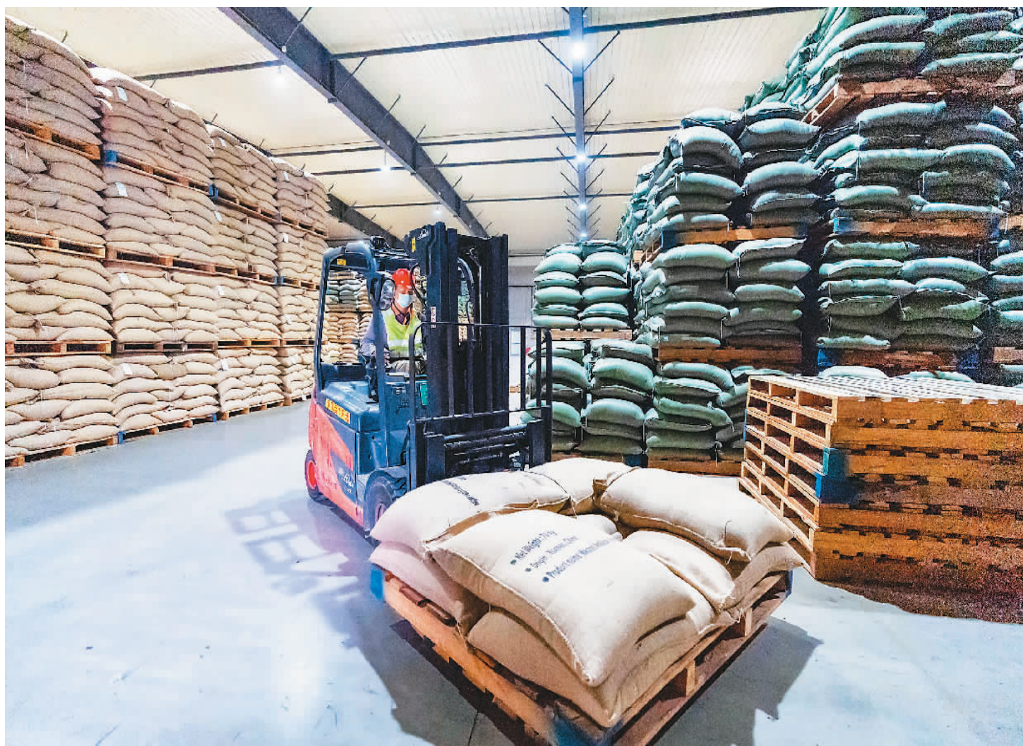
▼ 2月22日,工作人员在云南普洱雀巢咖啡中心仓库内工作。