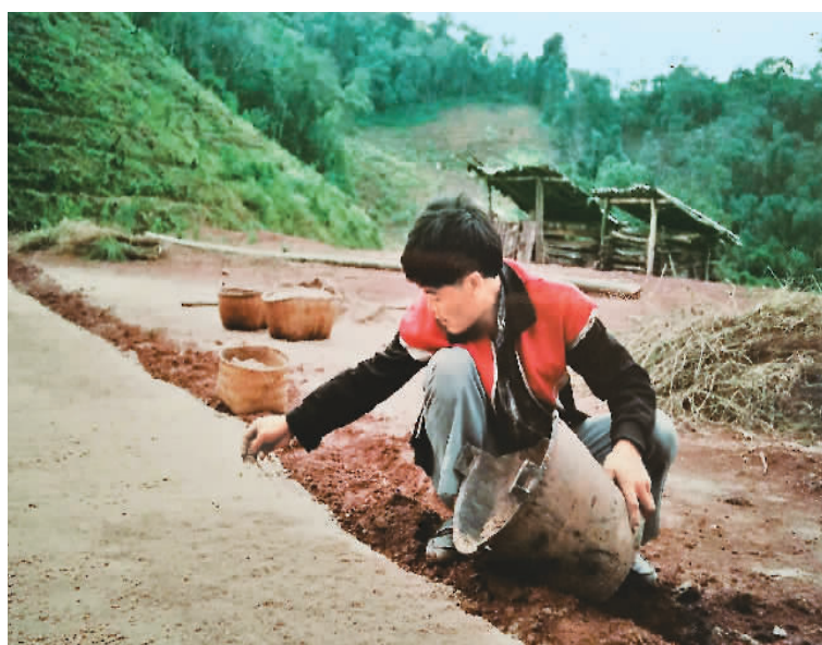
▲ 1997年拍摄的村民在云南普洱市思茅区小四子咖啡庄园内进行咖啡育苗。 (资料照片)