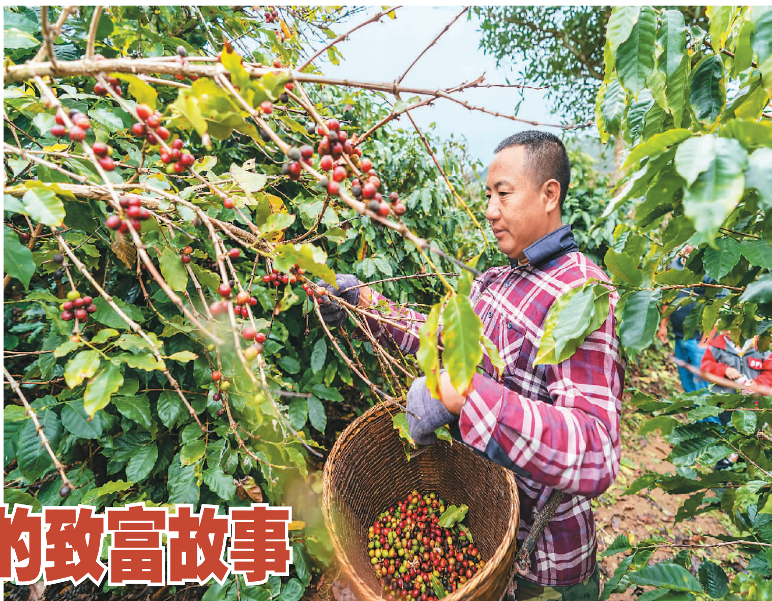
▶ 2022年2月23日,云南普洱市思茅区南屏镇大开河村的村民在采摘咖啡果。