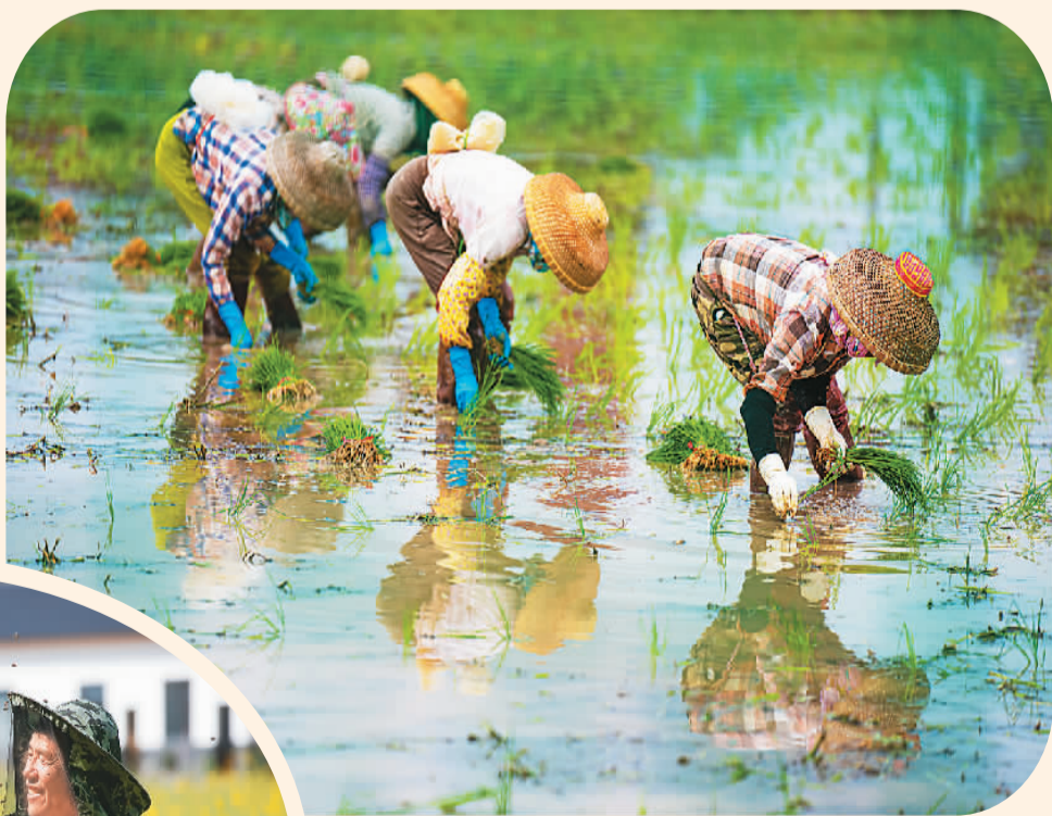
春日里，各地侨乡田间地头一派农忙景象。