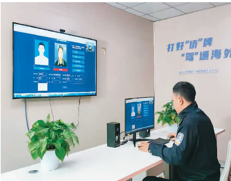
福州交警为海外侨胞远程办理驾驶证延期换证业务。

这样的故事并非个例。新冠肺炎疫情发生后，各地远程为侨服务更加精细化、规范化、便捷化，不断推出新举措、新平台，为海外侨胞排忧解难、提供便利。远程为侨，拉近侨心，海外侨胞更加深切地感受到来自家乡和祖（籍）国的温暖和关爱。