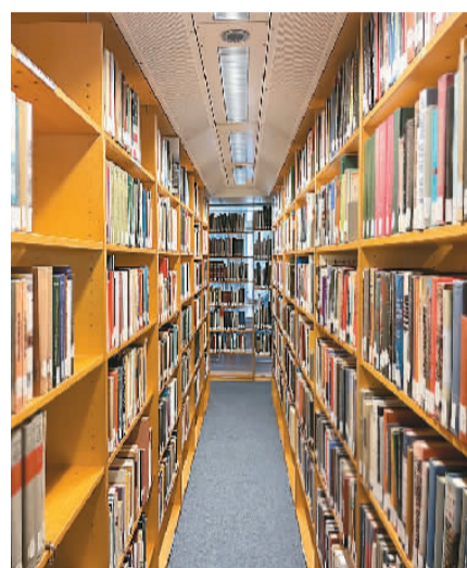
阿姆斯特丹大学霍夫特图书馆一角。

穿过古朴典雅的悠长小巷，伴着清脆悦耳的电车铃声，闻着河边集市飘来的阵阵花香，我一路匆匆地骑行，想要抓紧时间，在上课前到一趟宰格尔夫书集市。