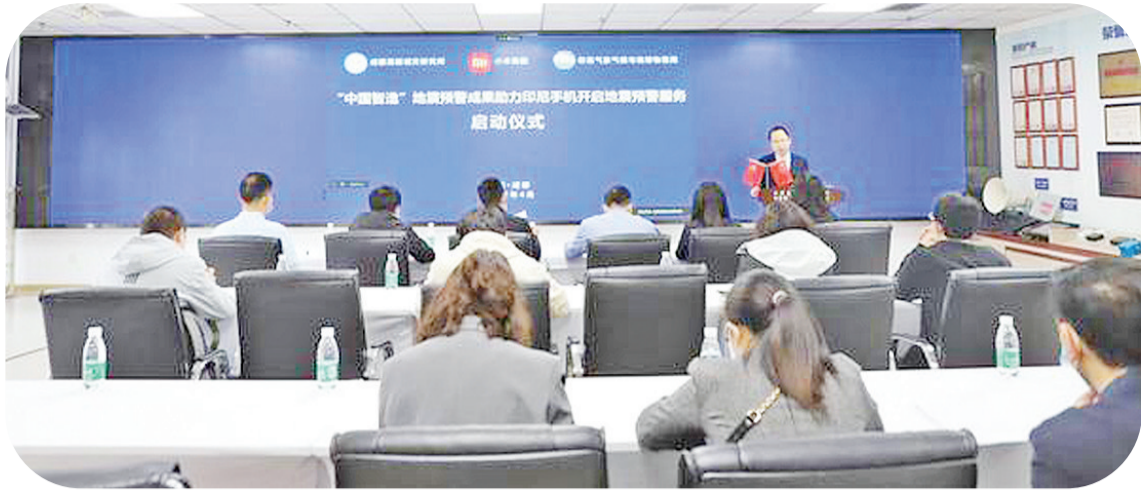
地震预警服务启动仪式现场

【本报讯】据中国驻印尼使馆消息：4月7日，成都高新减灾研究所和小米集团联合宣布在印尼开启手机操作系统内置地地震预警功能。该功能的开启，是“中国智造”地震预警成果在2019年支撑印尼建设地震预警网后，深入服务印尼地震安全的里程碑，也是“中国智造”预警成果近年来服务中国取得突出