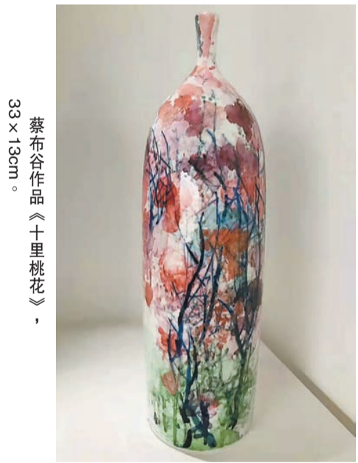
蔡布谷作品《十里桃花》，33 x 13cm。