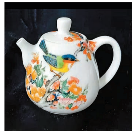
蔡布谷作品《布穀聲聲》，12 x 9cm。

在瓷器上作畫，跟紙上創作大為不同，須經歷多道程序，如高溫窯火的「助攻」與礦物顏料「熔融霧化」的窯變，將燒製瓷器與繪畫兩種技藝相結合，方能使作品具工藝品的實用和藝術品的美感。蔡布谷的陶瓷作品既有清新秀雅、也有寫意絢麗，放在室內一隅，更是充滿現代藝術感。