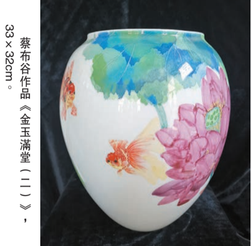
蔡布谷作品《金玉滿堂（二）》，33 x 32cm。