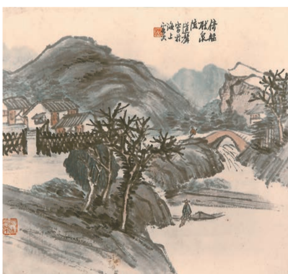
道聲作品《倚船聽泉圖》，28 x 33cm。

道聲的《倚船聽泉圖》則具另一番趣味。倘若前者是居於山中的安寧自得，後者便是身臨泉上的淡泊閒適。道聲，是民國時期海上畫派畫家。此圖描寫山居人家，小橋流水，倚船聽泉，策杖閒遊，內容豐富，清雅樸