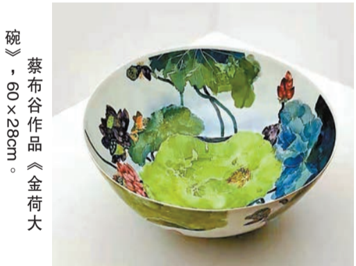
蔡布谷作品《金荷大碗》，60 x 28cm。