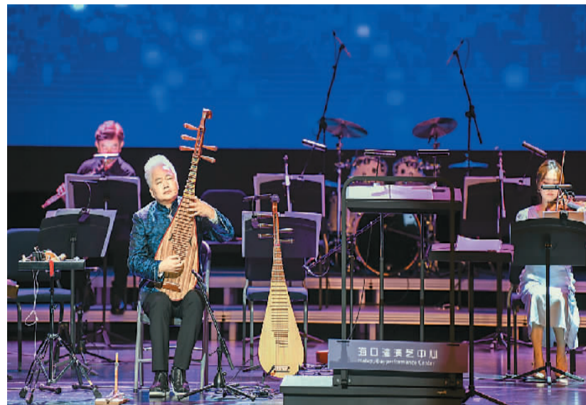
▲ 2021年6月，在海南省海口市海口湾演艺中心，国乐大师方锦龙联手新九州爱乐团，融合古筝、钢琴、琵琶、二胡与打击乐，演绎“国潮”魅力。

一部分国风歌曲吸收传统戏曲唱腔，大胆创新，收获大众喜爱。国风歌曲《赤伶》的歌词化用昆曲《桃花扇》的内容，表演者采用戏腔演唱，将流行音乐与戏曲元素巧妙融合。创作于2021年的《探窗》是一首以爱情为主题的国风歌曲，歌词凝练含蓄，富有古风意境。歌曲首发后，互联网涌现了诸多翻唱版本，其中上海戏剧学院学生采用京剧演唱的版本最引人注目，歌曲翻唱视频上传至短视频平台后迅速走红，播放总量超5000万，用户点赞量超250万，刷新了许多年轻人对中国传统戏曲的认识，也激发了观者模仿学习的兴趣。