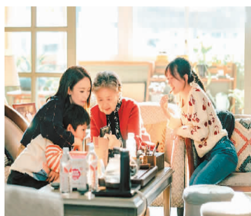
▲ 电视剧《心居》剧照。