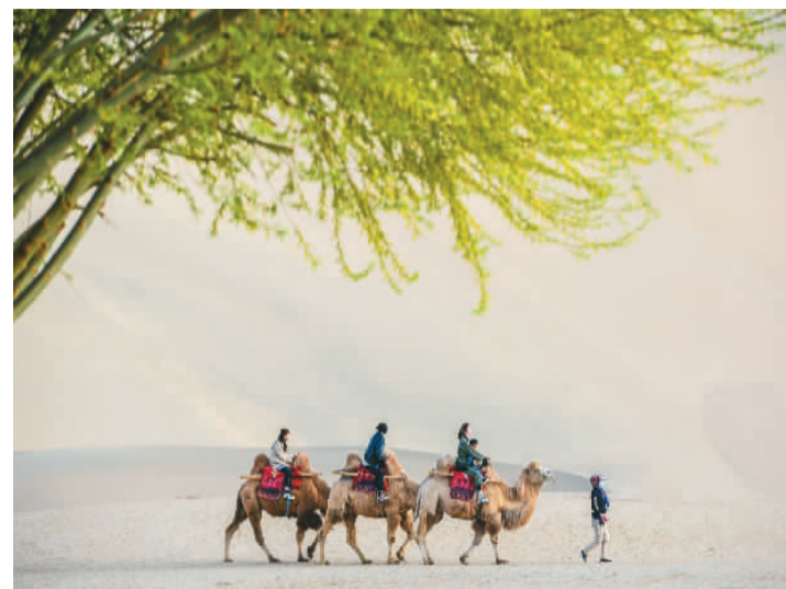
4月4日，甘肃敦煌春意渐浓，春花烂漫，吸引不少游客前来欣赏别样的大漠春色。图为游客骑骆驼观赏美景。