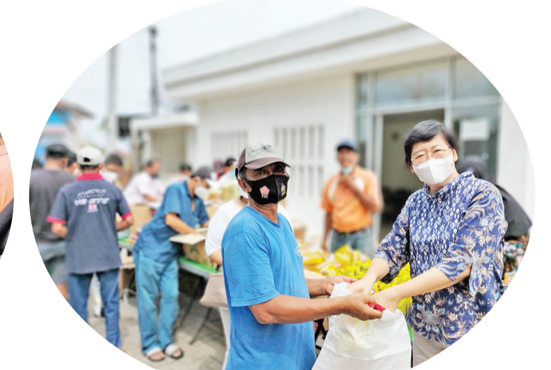
莫粧量令夫人协助分发