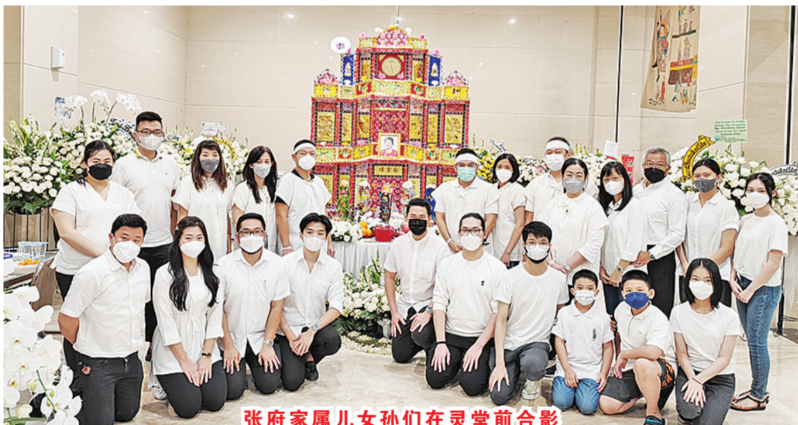
张府家属儿女孙们在灵堂前合影