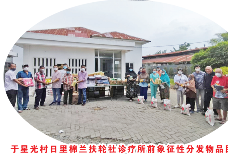
于星光村日里棉兰扶轮社诊疗所前象征性分发物品民众