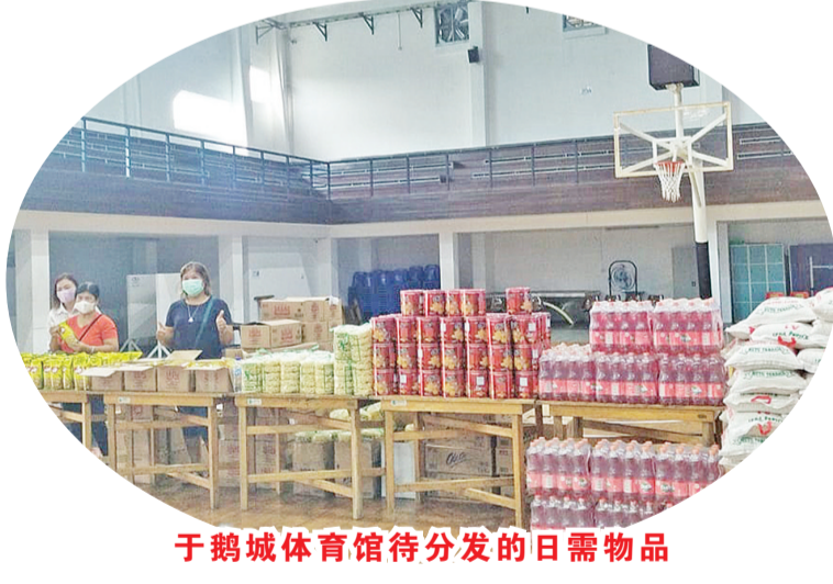
于鹅城体育馆待分发的日常物品