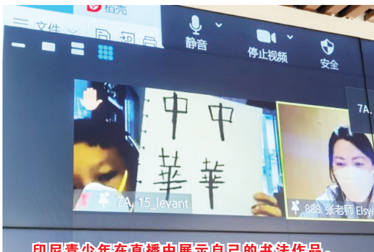
印尼青少年在直播中展示自己的书法作品。