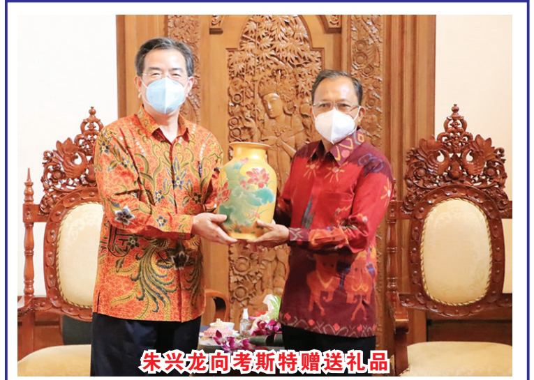
朱兴龙向考斯特赠送礼品

【本报讯】据中国驻印尼使馆消息：4月6日，陆慷大使到任拜会印尼前总统、民主党最高委员会主席苏希洛及民主党总主席阿古斯，就推进两国关系、党际交流合作以及共同关心的国际地区问题交换意见。