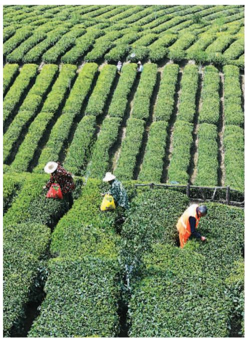
3月29日，茶农在湖北省宜昌市秭归县茅坪镇一茶园采摘“明前茶”。

立春咬春、春分蛋蛋、谷雨斗茶、立冬食蔗……什么节气做什么，什么气候预示什么，已经浸润到华夏民族的血脉中，使得中国人的生活极具韵律之美，反映了尊重自然、顺天应时的智慧。二十四节气是“中国人用大自然给生活加上的标点”，是华夏民族集体意识里的一套“天人感应装置”，穿越古今，历久弥新，在新时代必将焕发新的光彩和活力。