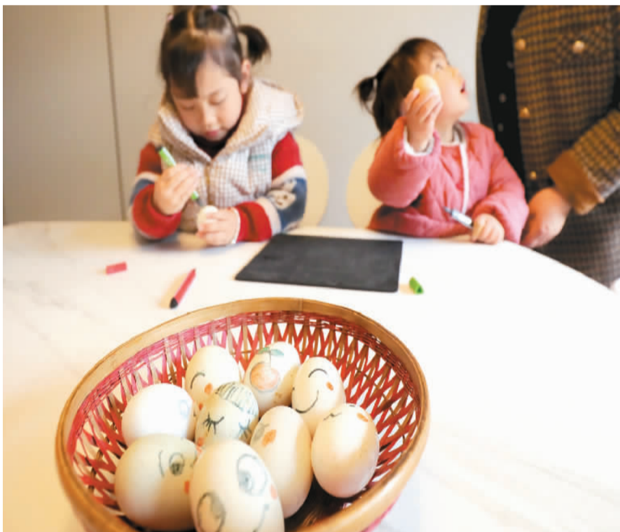
清明前夕，江西省宜春市宜丰县黄垦镇小朋友体验清明画彩蛋习俗。