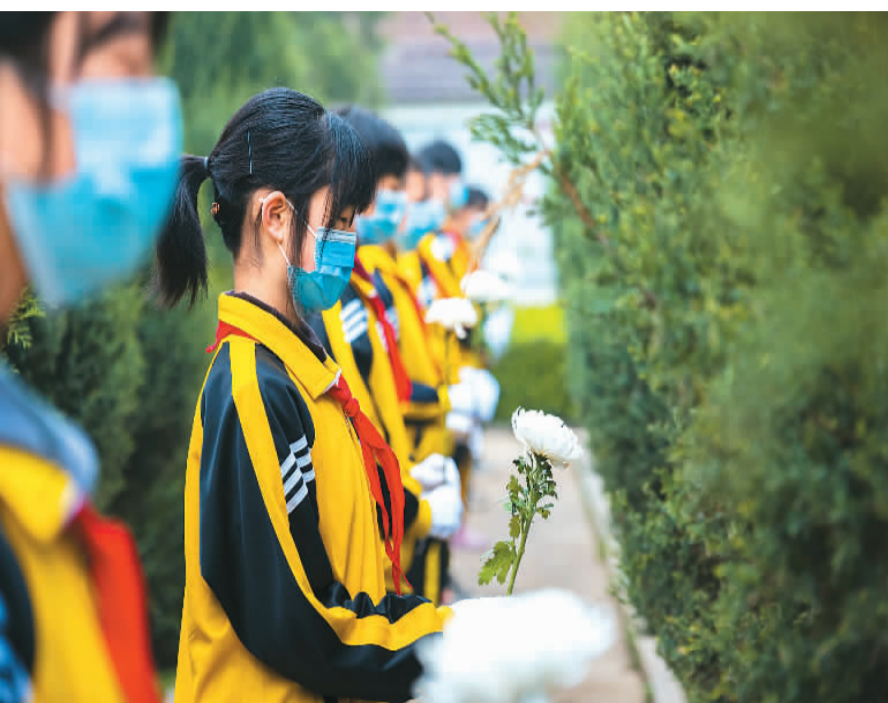
3月30日，河北省邢台市柏乡县西汪中心小学少先队员来到该县中鲁烈士陵园举行清明祭扫活动。

门上、檐下、床头、窗户、灶台等处，或者戴在头上、挂在项间，或者做成柳哨和绣球。柳树发芽早，是春天到来的象征，用嫩绿的柳条装饰家门、装点自己，增添了生机勃勃的春意。柳树插土就活，生命力极强，在古人心中具有“含精灵而寄生兮，保休休之丰衍”的神奇力量。俗语云：“清明不戴柳，红颜成皓首。”人们在清明戴柳，表达了永葆青春的愿望。