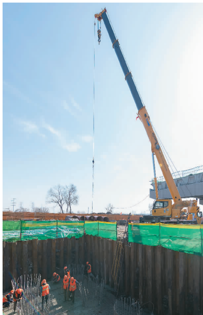
随着春季到来、气温升高，黑龙江省哈尔滨市多个重点项目开工复工。据了解，哈尔滨市今年年初计划推进省市重点项目400个，其中纳入省级“百大项目”105个。截至目前，哈尔滨市开工复工省市重点项目206个，其中省级“百大项目”70个。图为4月3日，在哈尔滨市道外区，工人在中铁一局北街门街高架工程施工现场作业。