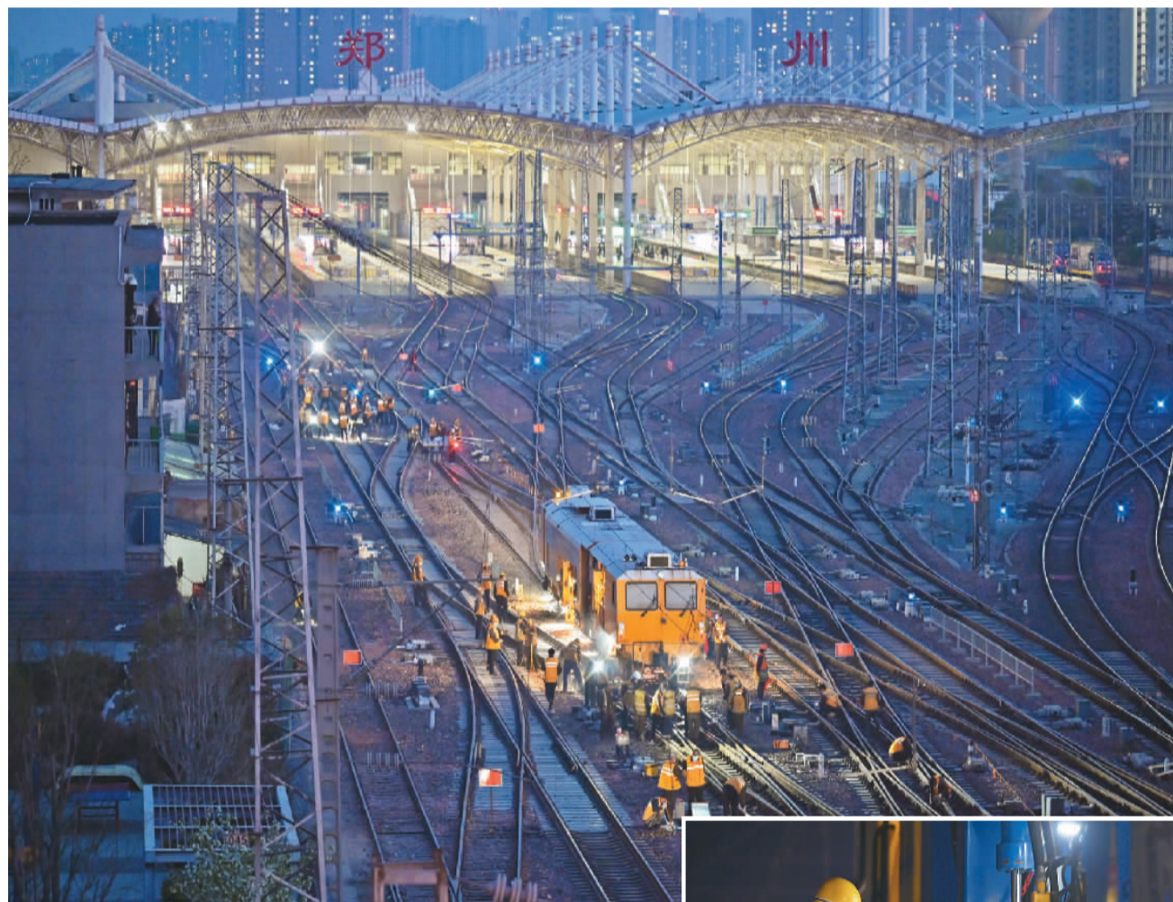
4月2日，郑州站大型养路机械车数字化捣固作业现场，施工人员正在配合机械车开展道岔精调。

近年来，甘肃省嘉峪关市文殊镇充分利用当地规模化、集约化等区域优势，积极引导农民种植大棚樱桃等错季水果，盘活城乡农业观光旅游采摘经济，有效带动了当地农业增效、农民增收。时下，文殊镇樱桃现代农业示范园区里的大棚樱桃已经成熟，吸引众多游客观光采摘。