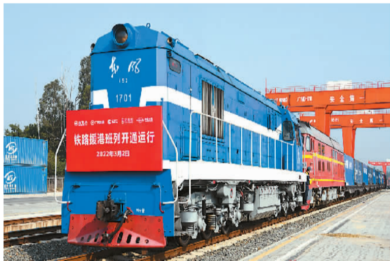
铁路援港班列驶出深圳平湖国家物流枢纽。

从“三趟快车”到援港班列,体现了中央政府对港澳一如既往的深切关怀,也饱含着内地人民对港澳同胞的深情厚谊。祖国对港澳的支持守护始终没有停止过,很多人不知道,香港约90%的鲜活食品、约80%的淡水、约25%的电力,都源自祖国内地。“三趟快车”从开行以来,参与的人