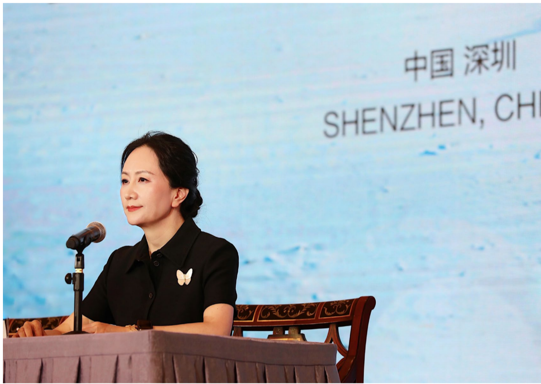
孟晚舟對華為2021年年度財務數據作解讀，並接受全球媒體提問。