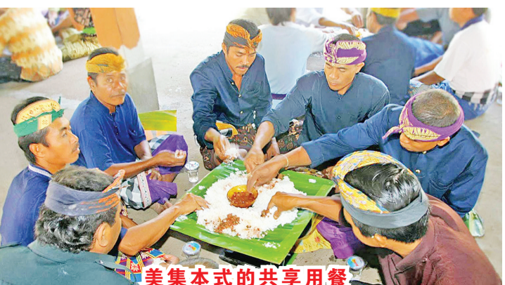
美集本式的共享用餐