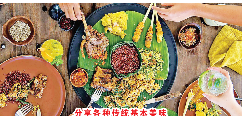
分享各种传统基本美味