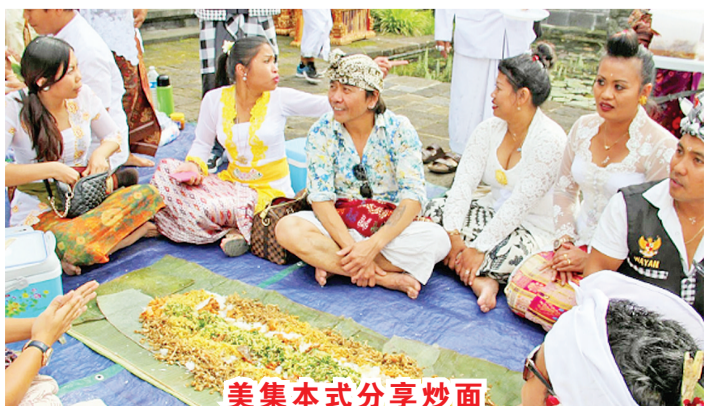
美集本式分享炒面