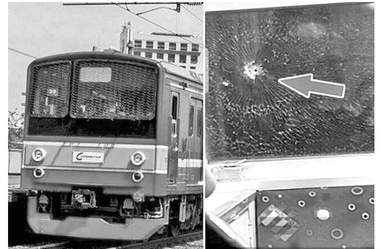
雅加达红牌-巴油兰旧区通勤列车遭气枪击破右侧挡风玻璃

【本报讯】警方仍在调查枪击雅京丹拿望(Tanah Abang-兰加士勿洞(Rangkasbitung)通勤电车事件。到目前为止,警方尚未透露枪击通勤电车枪击事件的肇事者是什么人。