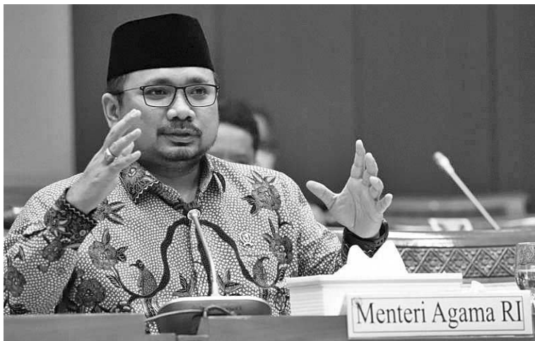
宗教部长雅谷要求穆斯林明智地应对1443H斋戒月首日的分歧

【本报讯】宗教部长雅谷(Yaqut Cholil Qoumas)要求穆斯林明智地应对今年斋戒月开始时的分歧。众所周知,政府已将1443H斋戒月的首日定为今年4月3日(星期日)。可是,穆协(Mahammadiyah)将4月2日(星期六)定为斋戒月的首日。