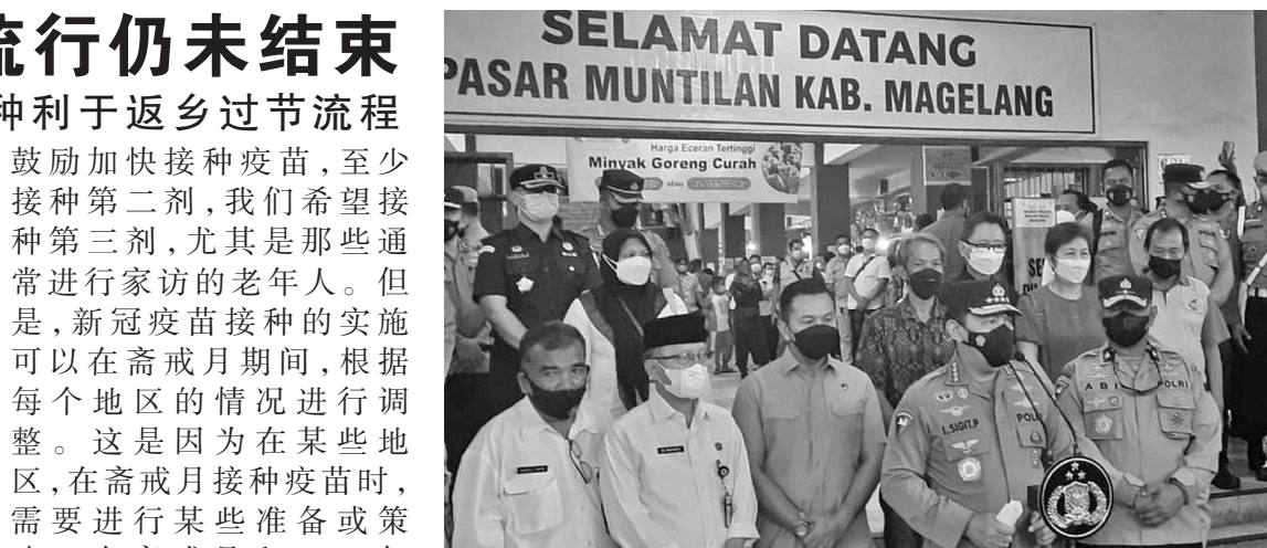
总警长里斯提约将军声称,加速疫苗接种利于返乡过节流程

【本报讯】总警长里斯提约将军(Listyo Sigit Prabowo)要求所有警察成员和公众在2022年开斋节返乡季节之前加速接种新冠疫苗。