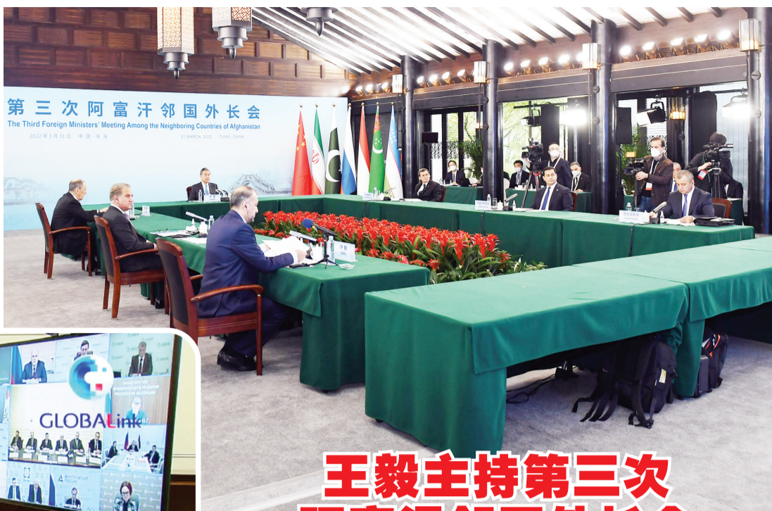
第三次阿富汗邻国外长会

▼新华社莫斯科4月1日电 俄罗斯总统普京3月31日签署与“不友好”国家和地区以卢布进行天然气贸易结算的总统令，新规定自4月1日生效。普京表示，要购买俄天然气，“不友好”国家和地区须在俄银行开设卢布账户，如果拒绝以此方式付款，俄方将认为这是买方违约，一切后果应由买方承担。普京说，俄天然气供应改用卢布结算是加强俄金融和经济主权的重要一步。俄罗斯能源在欧洲国家能源需求中占重要地位，目前欧盟所需天然气约40%从俄罗斯进口。(记者：胡晓光、陈端、李铭、李奥、耿鹏宇；剪辑：王科文；编辑：王丰丰、鲁豫) 新华社国际部制作 新华社国际传播融合平台出品