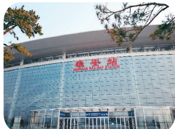
▲ 京雄城际铁路雄安站。新华社记者 骆学峰摄