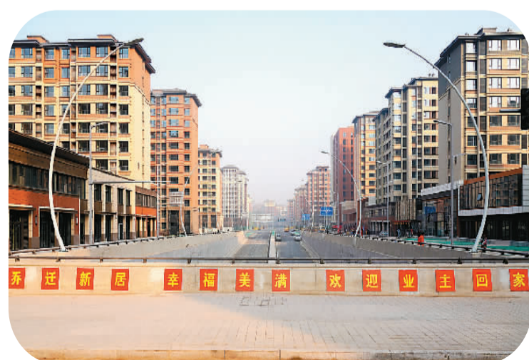
▲ 雄安新区容东片区E组团集中交付的安置房（1月17日摄）。地上建筑包含157栋住宅楼、2所幼儿园、1所小学及1所社区服务中心，共计9147户精装修住房，可安置居民近3万人。