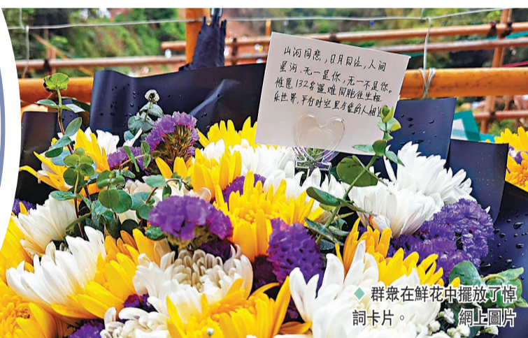
群眾在鮮花中擺放了悼詞卡片。