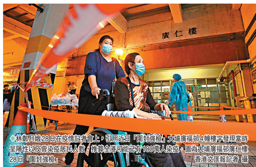
林鄭月娥28日在抗疫記者會上，引用近日「圍封強檢」大埔廣福邨4幢樓宇發現當時呈陽性以及曾染疫居民人數，推算全港可能已有180萬人染疫。圖為大埔廣福邨廣仁樓28日「圍封強檢」。

香港衛生防護中心傳染病處主任張竹君28日在疫情簡報會上釐清死亡率概念，指香港每日公布的是呈報個案病死率，是比較普通的說法，並非專有名詞，「病死率」才能更準確地反映情況，但要逐宗個案分析死因。對於有專家建議用估算的實際確診數字推算，但她認為始終沒有確實的數字作分母扣除，其數值亦只能用作參考。現唯一可做的，仍只能用已呈報的個案去計算。