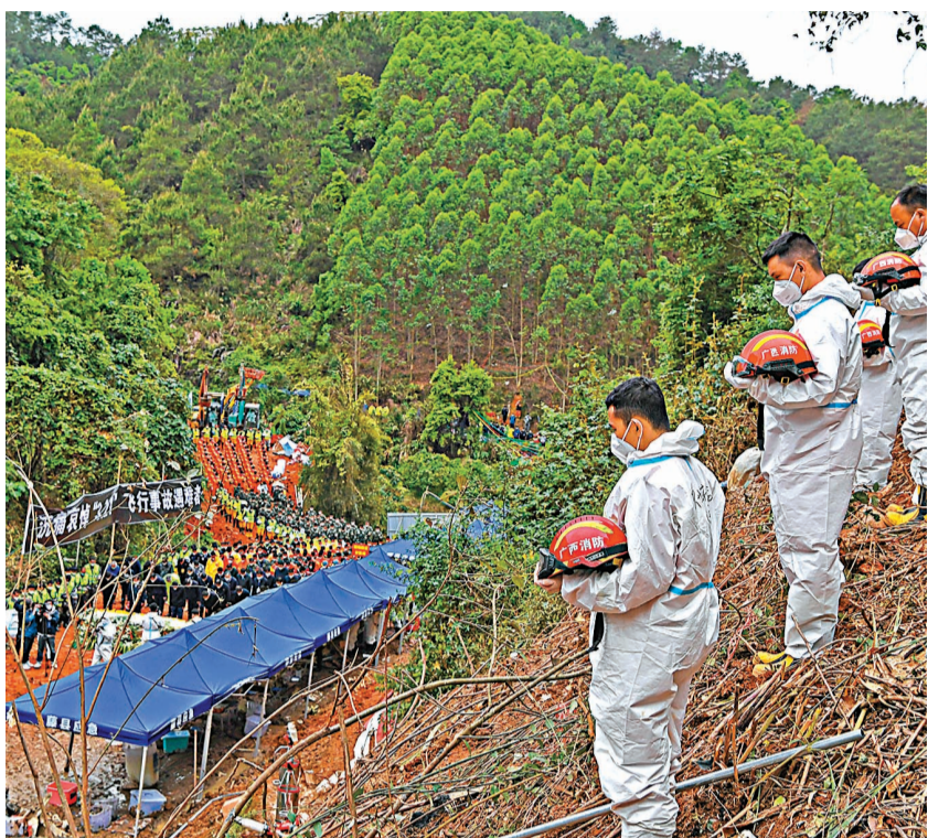
3月27日下午，「3·21」東航MU5735航空器飛行事故遇難者集體哀悼活動在事發地搜救現場舉行，對遇難者表示哀悼。

香港文匯報訊 綜合新華社、央視新聞及中新社報道，3月28日下午，中共中央政治局召開會議，研究近期有關工作。會議開始時，經中共中央總書記、國家主席、中央軍委主席習近平提議，出席會議的中共中央政治局委員等全體起立，向「3·21」東航MU5735航空器飛行事故遇難同胞默哀。