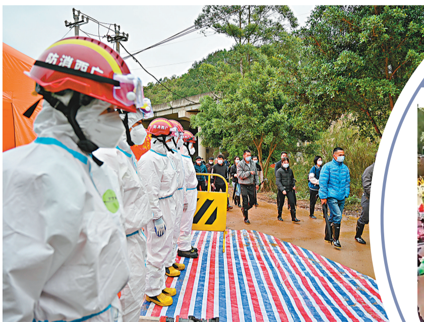
3月27日，遇難者家屬前往事故搜救現場哀悼逝者，一旁消防救護人員肅穆而立。

朱濤表示，到27日上午為止，失事航班的兩部黑匣子均已找到，相關譯碼工作正在進行中。但是大型空難調查僅依靠黑匣子提供的數據往往不足以還原事件全部真相，因此在推進譯碼工作同時，「我們還在盡最大努力收集盡可能多的飛機殘骸和與事故相關的視頻、目擊信息，對已找到的殘骸進行分類整理、分析，對視頻拍攝者與目擊者進行訪談，對視頻拍攝設備、時間、地點、拍攝角度進行分析。通過這些努力，一旦調查取得重大進展，我們將及時公布。」