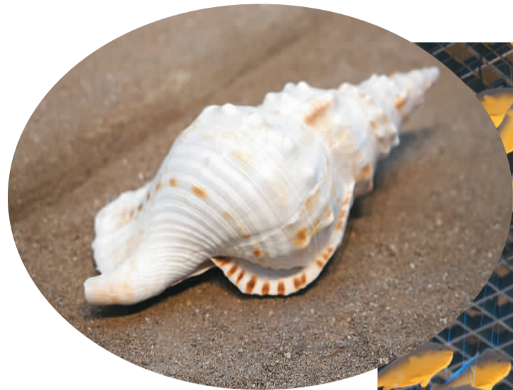
▲法螺标本。 人民网 章勇涛摄 ▶小黄鱼群模型。 人民网 章勇涛摄