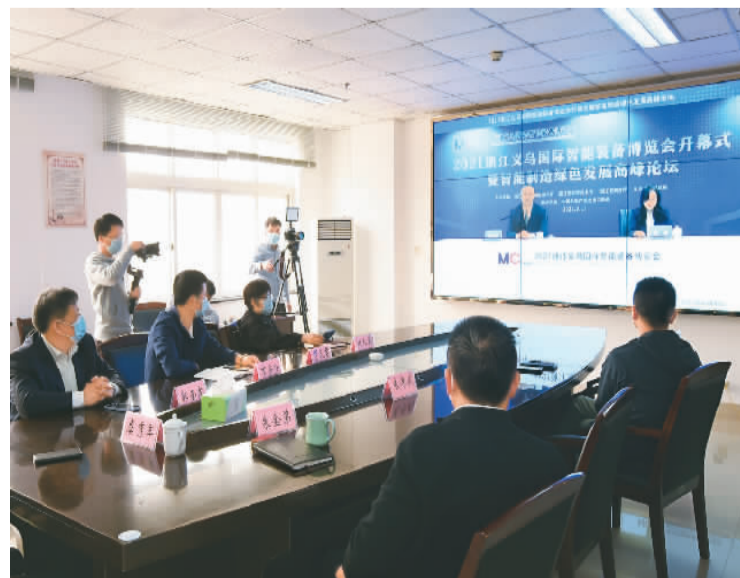
3月15日，浙江义乌国际智能装备博览会开幕式在线上举行。

数字经济发展让广大群众享受到看得见、摸得着的实惠。“十四五”时期，更多的人将拥抱数字生活。国务院近日印发的《“十四五”数字经济发展规划》提出，打造智慧共享的新型数字生活。