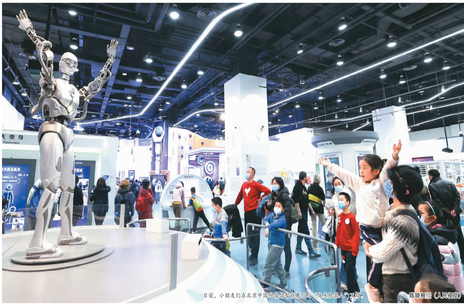
日前，小朋友们在北京中国科技馆智能展厅与“仿生机器人”互动。