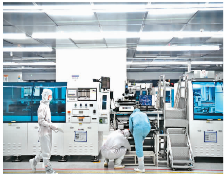
2月19日，工人在江西省赣州经开区同兴达电子科技有限公司数字化生产车间加工智能穿戴设备。