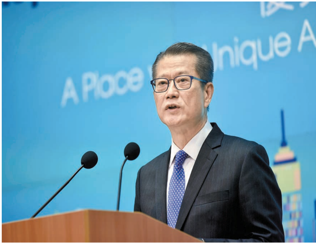
陳茂波坦言第一季本港經濟承受龐大壓力。

【香港商報訊】財政司司長陳茂波在最新發表的網誌中形容，今年第一季度充滿驚濤駭浪。由於新冠疫情第五波兇猛來襲，國際地緣政治局勢緊張及通脹升溫，令本港在社會、民生及經濟承受着龐大的壓力。他坦承，本港經濟第一季度將陷入收縮，但他對香港經濟前景依然有無比堅定的信心。