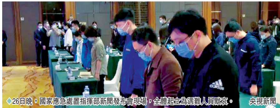
26日晚，國家應急處置指揮部新聞發布會現場，全體起立為遇難人員默哀。央視新聞