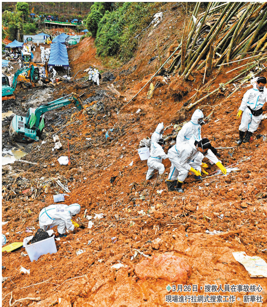
3月26日，搜救人員在事故核心現場進行拉網式搜索工作。新華社

香港文匯報訊 據新華社報道，「3·21」東航MU5735航空器飛行事故國家應急處置指揮部26日晚間確認，「3·21」東航MU5735航班上123名乘客和9名機組人員已全部遇難。 「3·21」東航MU5735航空器飛行事故國家應急處置指揮部現場副總指揮、民航局副局長胡振江在當晚的新聞發布會上說，按照黨中央、國務院對「3·21」東航MU5735航空器飛行事故處置的有關要求，「3·21」東航MU5735航空器飛行事故國家應急處置指揮部組織消防救護人員、解放軍指戰員、武警官兵，以及公安、衛生檢疫、交通、自然資源等多部門連續6天在事故發生區域開展「拉網式」排查，並組織專家比對分析各類監控、記錄設備中的視頻影像內容，綜合分析空管雷達、ADS-B等設施設備記錄的關鍵數據，特別是對墜機現場殘骸分布的勘查判斷和分析，可以確定搜尋現場已無生命跡象，通過DNA鑒定已確定120名遇難者身份。