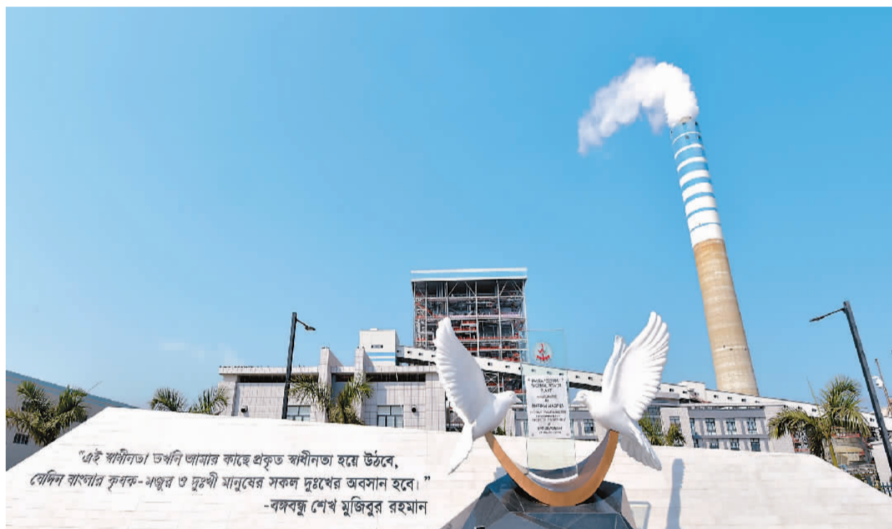
中孟合资公司运营的孟加拉国最大电站项目帕亚拉2×660兆瓦超超临界燃煤电站落成典礼近日举行。随着该电站正式投运，孟加拉国进入了电力全覆盖的新时代。

图为3月21日在孟加拉国南部博杜阿卡利县拍摄的帕亚拉2×660兆瓦超超临界燃煤电站。