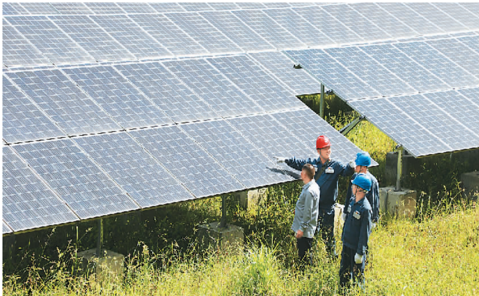
▲近年来，贵州省铜仁市推动荒坡山地效益最大化，让光伏清洁能源成为群众增收的“绿色银行”。图为3月25日，在铜仁市印江县杉树镇孟郊村光伏发电项目基地，南方电网贵州铜仁印江供电局工作人员为光伏电站进行设备检查。

国家能源局有关负责人表示，“十四五”时期，中国将加快构建新发展格局，新型工业化和城镇化深入推进，扩大内需战略深入实施，能源