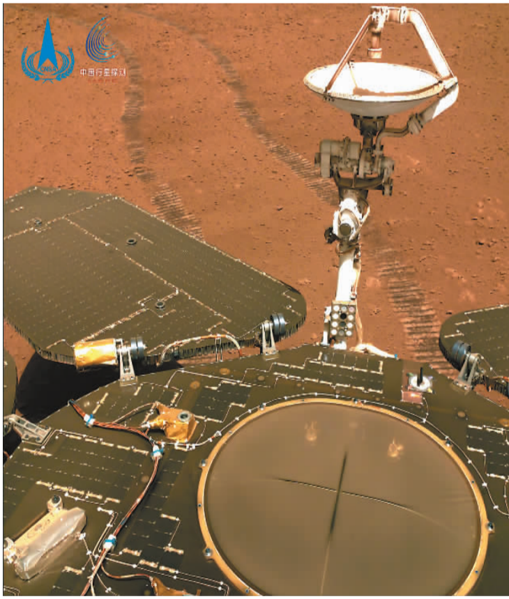
右图：2022年1月22日（着陆后第247个火星日），“祝融号”火星车表面存在明显的沙尘覆盖。

本报北京3月24日电（记者冯华）记者从国家航天局获悉：截至2022年3月24日，“祝融号”火星车在火星表面工作306个火星日，累计行驶1784米，“天问一号”环绕器在轨运行609天，距离地球2.77亿千米，当前两器运行正常。