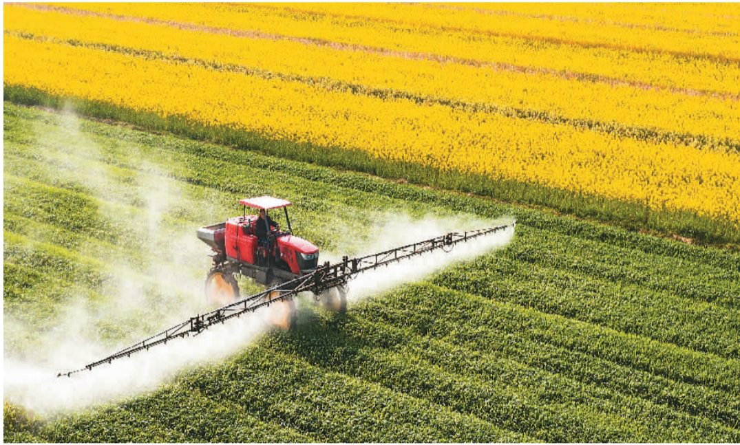
三月二十三日，江苏省淮安市淮阴区现代农业产业园内，村民驾驶植保机在小麦田间进行药物喷洒作业。

粮食尽管连年丰收，但并非可以高枕无忧。受去年罕见秋汛影响，冀鲁豫豫陕5省冬小麦晚播面积1.1亿