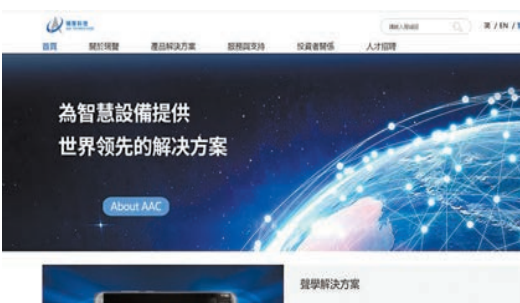
瑞聲預料，聲學業務應該會有更好表現，對手機鏡頭表現看法樂觀。

另外，發改委發布《氫能產業發展中長期規劃(2021-2035年)》，提出探索在氫能應用規模較大的地區，設立製氫基地，帶動氫能概念股狂飆。京城機電(187)昨狂飆25.98%，收報5.14元；中集安瑞科(3899)昨升9.7%，收報9.73元。不過，周一(21日)公布全年業績時宣布暫停派發紅股的煤氣(003)，周二被洗倉後，昨續跌3.91%，收報9.59元。